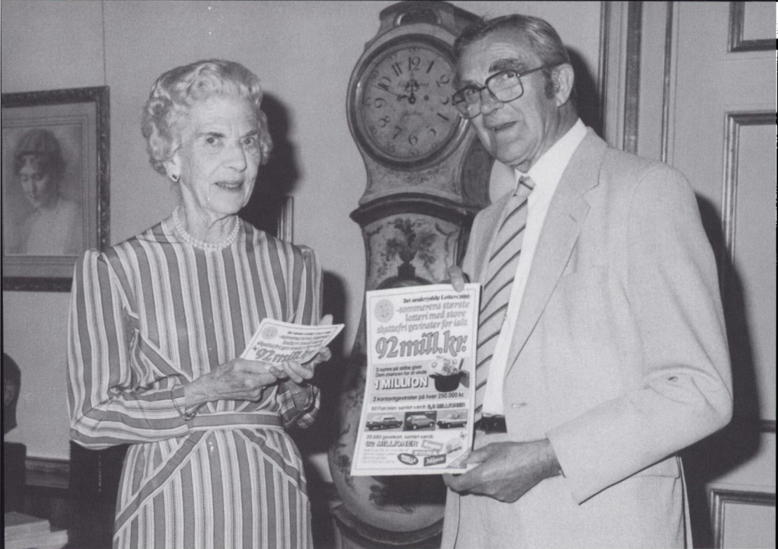
Dronning Ingrid køber lodseddel fra Det sønderjydske Lotteri 1986.

Selv om Grænseforeningen var en velsmurt organisation, hvor formandsskifter ude omkring afvikledes i mindelighed og uden den store debat, kunne der opstå brist. Der kunne være personer, som det enten var svært at samarbejde med, eller som ligefrem forsømte den opgave, de måske mere eller mindre nødtvunget havde påtaget sig. Der var også dem, som slet ikke forstod at tiden kunne være inde til et skifte. Det krævede nogle gange flere samtaler, hvis ikke man ligefrem skulle bruge manipulation eller et mildt pres og vejledning, så et formandsskifte kunne gennemføres uden at skabe alt for stort røre. Overfor en passiv og direkte ubrugelig lokalformand kunne det blive nødvendigt at gå en helt anden vej, nemlig at nedlægge foreningen, og enten lade den genopstå eller lægge den sammen med en naboforening. Nogle få gange mislykkedes alle vore bestræbelser.