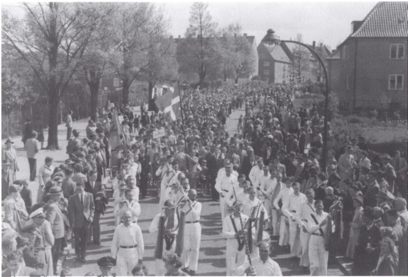
Glimt fra årsmødeoptøget i Flensborg 1957. Flensborg 3. distrikt på vej til årsmødet under Dannebrog og den slesvigske løvefane. Først fra midten af 1950'erne var det tilladt at føre Dannebrog i optog. Foto i Dansk Centralbibliotek for Sydslesvig.

Det viste sig herefter meget nemt at komme til Sydslesvig. Straks jeg søgte igen – til landbrugsforedrag – gik det i orden, og tredje gang fik jeg løbende visum, så nu var døren for alvor åben.