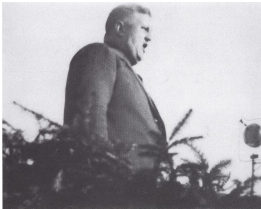
Frits Clausen taler ved et nazistisk møde i Bovrup 3. sept. 1933.