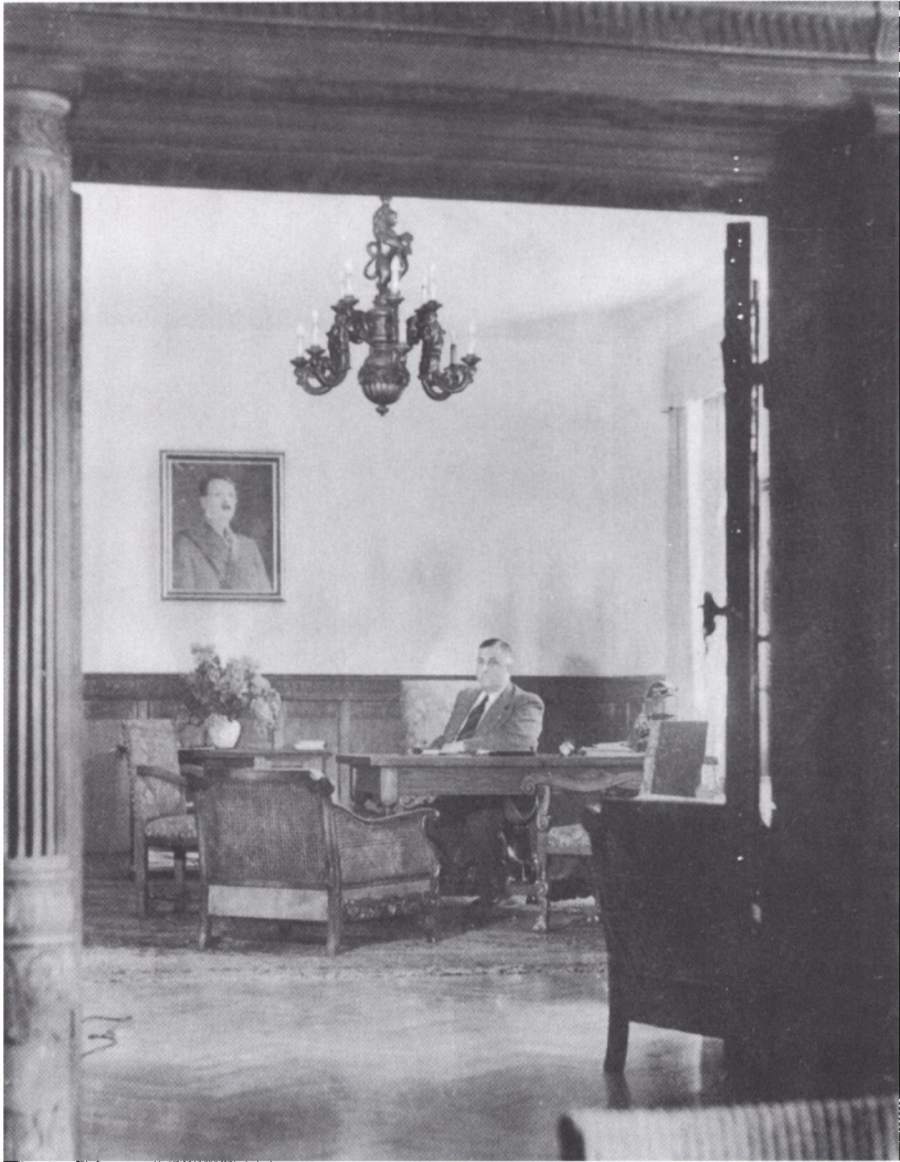
Frits Clausens yndlingsbillede af sig selv blev udsendt af DNSAP som postkort 1941. Det viser ham i førerhovedkvarteret i Rosenvængets Allé i København med Adolf Hitler på væggen. Original i Institut for sønderjysk Lokalhistorie.

Faktisk viser det 20. århundredes politiske historie, at »førerkup«, som det, der her er blevet rullet op, er ret så sjældne, når vi nøjes med at betragte statsbærende, d.v.s betydende førerpartier. Systemerne kan ganske enkelt ikke bære det. De er så belastede af førerdyrkel-