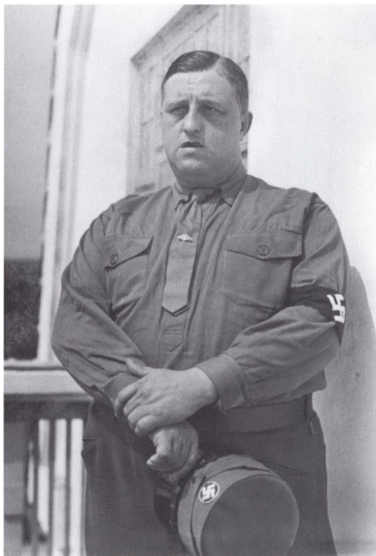
Portræt af Frits Clausen omkring 1934, som han uniformeret blev præsenteret på postkort og i partiets øvrige propagandamateriale.