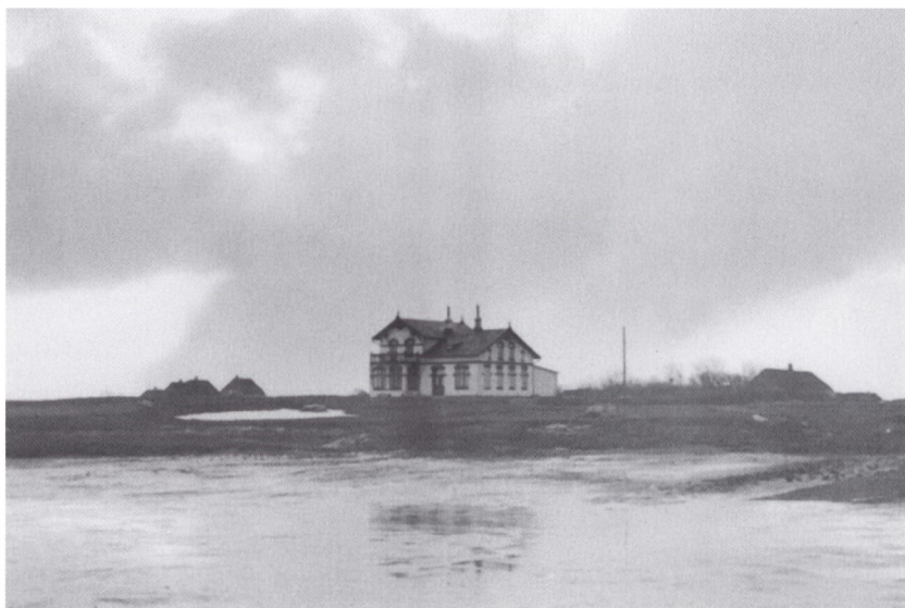
Billedet viser den fritliggende lægebolig i Kongsmark. Byggeriet stod færdig til indflytning i 1904 og kostede 9.000 rigsmark. Huset rummede en fireværelseslejlighed samt lægepraksis. Denne omfattede bl.a. en konsultationsstue, et venteværelse samt et lille rum til apoteksudsalget. Af husets ca. 100 m 2 var de 74 privatbolig.

sked, at staten fra 1. april 1881 var villig til at betale et årligt beløb på 600 Mark til en læge, der havde til hensigt at nedsætte sig på øen. Imidlertid var hertil knyttet den betingelse, at øboerne gav et tilskud af tilsvarende størrelse. Dette blev accepteret af Rømø-beboerne.