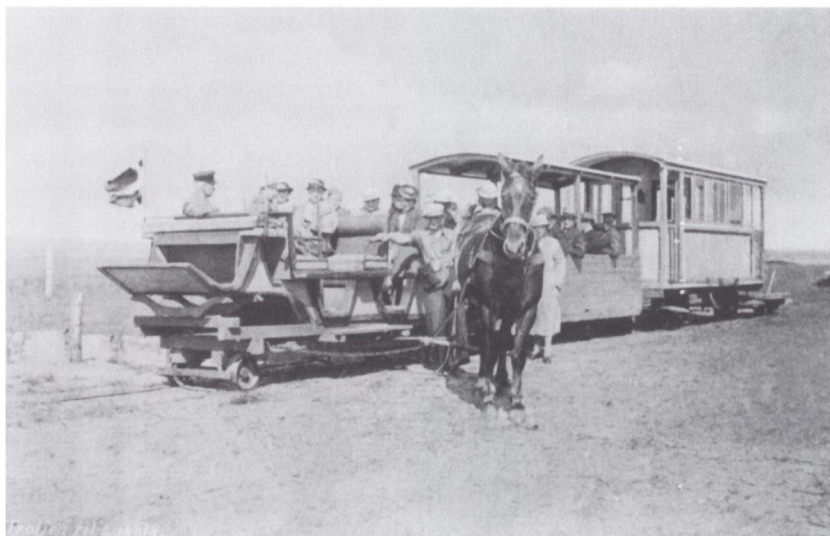
Billedet viser troljevognen trukket af en hest på vej gennem klitterne. Linjeføringen gik fra Lakolk til Kongsmark. Driften blev påbegyndt kort efter badets indvielse og fortsatte frem til 1940.

ringspræsidenten i Slesvig med henblik på at få honorarerne forhøjet. I disse overvejelser indgik, at man skulle pålægge Nordseebad Lakolk G.m.b.H. et fast bidrag for, at patienterne kunne få konsultationer i Lakolk. Et beløb på 200 Mark blev nævnt. I en skrivelse til landråden fra 24.8.1907 melder badets direktion hus forbi, idet dets økonomi angiveligt var så anstrengt, at det ikke ville være i stand til at betale et fast lægehonorar for sine gæster.