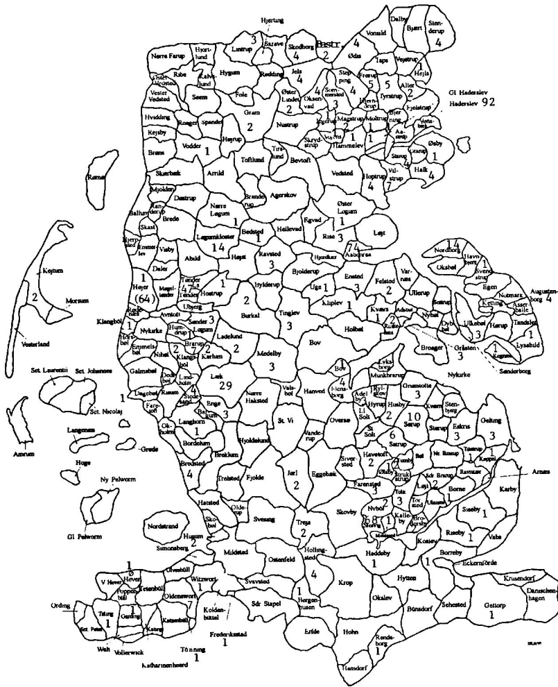
Kort 3: Medlemmer af »Den slesvig-holstenske patriotiske Forening« 1845-50 (i her-tugdømmet Slesvig).

meget beskeden. 32 Ligesom over halvdelen af sognefogderne fra Sognefogedforeningen undlod at indmelde sig i Den slesvig-holstenske patriotiske Forening, var der altså langt fra at underskrive en sogneopstand til at melde sig ind i den nye forening. Nok kunne der gå en vej fra slesvigsk konservatisme til slesvig-holstenisme, men den var snarere en smal sti end en bred motorvej! Blandt de mange tilhængere