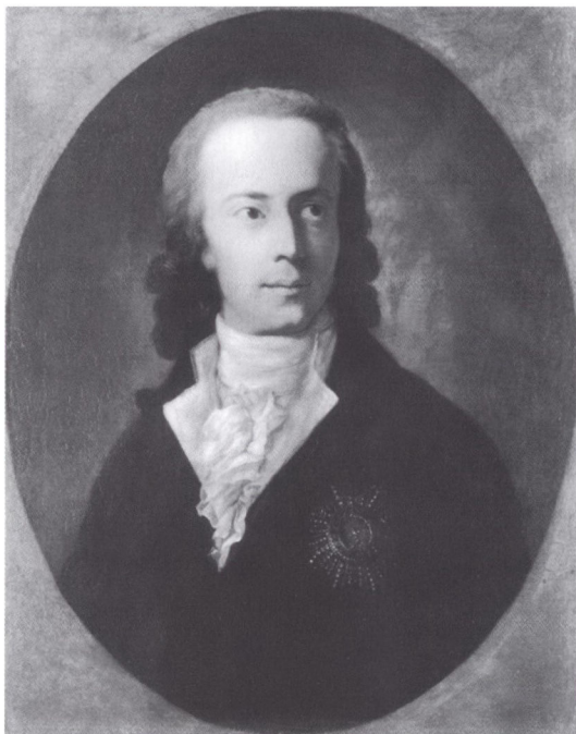
Hertug Frederik Christian af Augustenborg (1765-1814) udførte et stort arbejde indenfor uddannelsespolitikken, men kom efter 1806 i stadig større modsætningsforhold til kronprins Frederik (6.). Maleri af Anton Graff 1791.