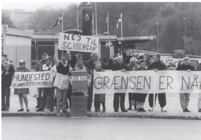
»Grænsekæden« ved Kruså den 10. maj 1997.

del af Sydslesvig, som tyskerne kalder for »Planungsraum V«, dvs. Sydslesvig uden Rendsborg-Eckernförde amt. Region Slesvig gælder altså ikke for hele Slesvig!