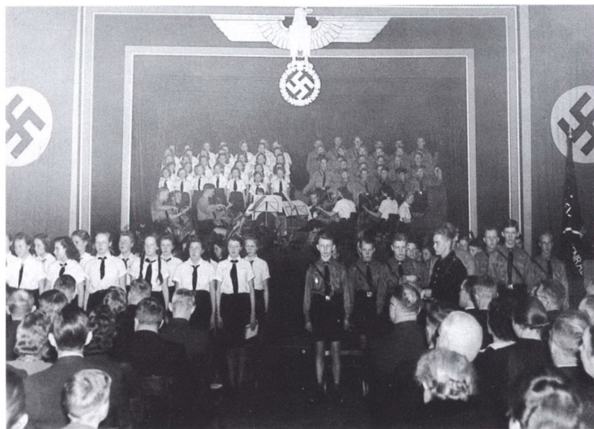
Nazistisk konfirmation i Aabenraa 1944. Fra 1939 indførtes den nazistiske konfirmation, kaldet »Verpflichtung der Jugend«, hvori de 14-årige skulle sværge troskab til fører og fane. Hos Hitler-Jugend markerede denne Verpflichtung en overgang til det egentlige Hitler-Jugend, men i mindretallet fandtes denne formelle skelnen ikke. Dette og de følgende billeder stammer fra Institut for sønderjysk lokalhistorie i Aabenraa.

målet var dobbelt: Dels at vandre – det var en vigtig del af forbundsungdommens idégrundlag. (man talte om ungdomsvandring som en helbredende eller forebyggende foranstaltning over for tuberkulose, kønssygdomme (!), alkohol og andre kropslige nedbrydelser 3 ), og dels var vandrehjemmene et vigtigt bindeled mellem tysk ungdom i Nordslesvig og tysk ungdom i Slesvig-Holsten. I 1925 oprettedes en særlig nordslesvigsk afdeling af »Reichsverband für deutsche Jugendherbergen«, som i 1935 blev til et selvstændigt forbund kaldet »Deutsches Jugendherbergswerk Nordschleswig.«