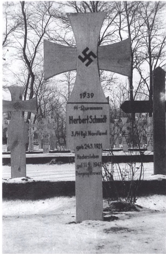
Tysk gravsten fra Rusland. Omkring 2.100 meldte sig til tysk krigstjeneste fra det tyske mindretal i Danmark, langt størstedelen til Waffen-SS. Der eksisterer ikke præcise tal for Jungenschaftlernes samlede indsats i tysk krigstjeneste. I 1944 opgjorde man dog antallet af DJN-førere i tyske enheder til omkring 280.

I løbet af krigen steg antallet af DJN-førere i krigstjeneste markant i forhold til det samlede antal frivillige fra mindretallet. 33 Størstedelen af tilgangen skyldtes, at lærere, der tidligere var blevet erklæret for uundværlige for hjemstavnen, nu blev indkaldt.