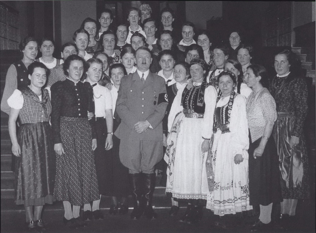
I 1937-38 besøgte folketyiske pigoledere, herunder Mädchenschaftlerne fra Nordslesvig, føreren i Berlin. De nordslesvigske Mädchenschaftler har almindelig Mädchenschafts-uniform på, dvs. mørk nederdel, hvid skjorte og tørklæde.

bundsungdommen var en borgerlig ungdomsbewægelse, hvor bl.a. det frie liv i naturen, ungdommen som særskilt livsstadie og unges »selvopdragelse« blev sat i fokus. Repræsentanter for bündische Jugend var bl.a. Wandervogel-bewægelsen.