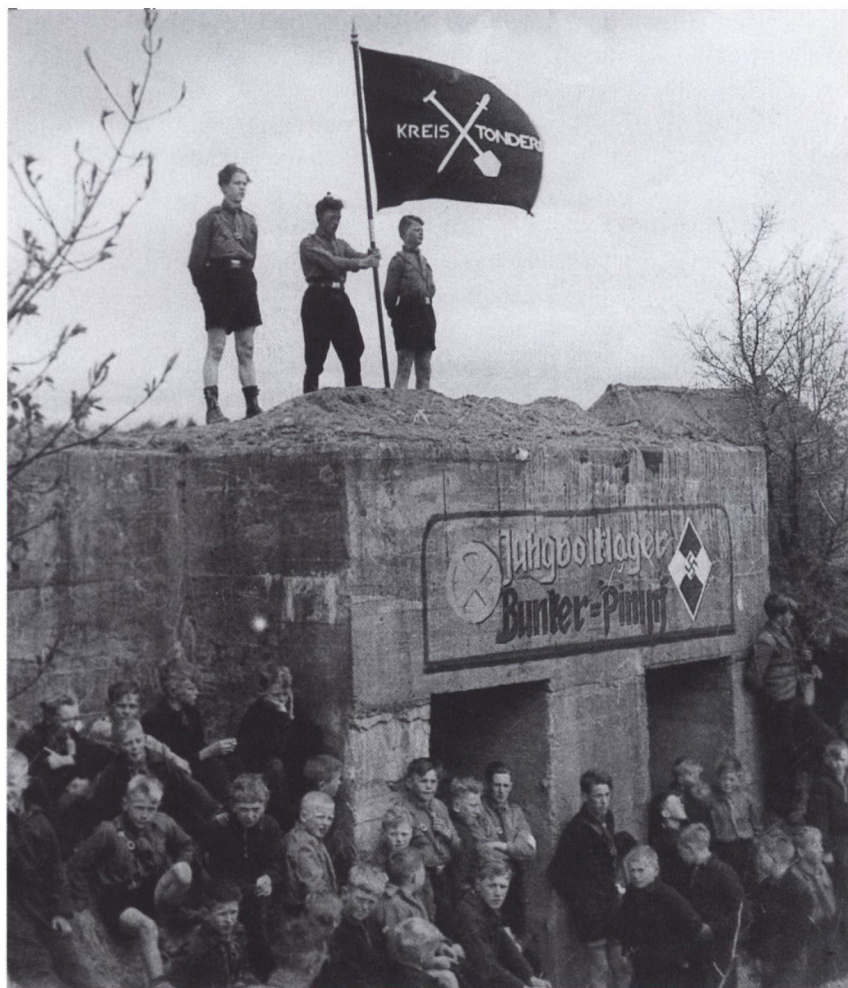
Lejrene var en vigtig del af Jungen- og Mädchenschafts virke. Udover påskelejren, som var den vigtigste, var der f.eks. førerlejre, lejre for de yngre og ældre medlemmer, musiklejre, lejre for unge bønder. Billedet her er fra en »Jungvolklager«, dvs. for de 9-14-årige. Læg mærke til DJN's kredsflag, der har spaden og sværdet som symboler.

år. I de følgende år afholdtes lejrene hos forskellige landmænd i Sønderjylland med deltagelse af rigstyskere og tyskere fra andre mindretal (folketyskere). Mädchenschaft var involveret i påskelejren ved at lave mad. I påskelejren forenedes de discipliner, som DJN dyrkede i det daglige: Ideologi, terrænsport og almindelig sport.