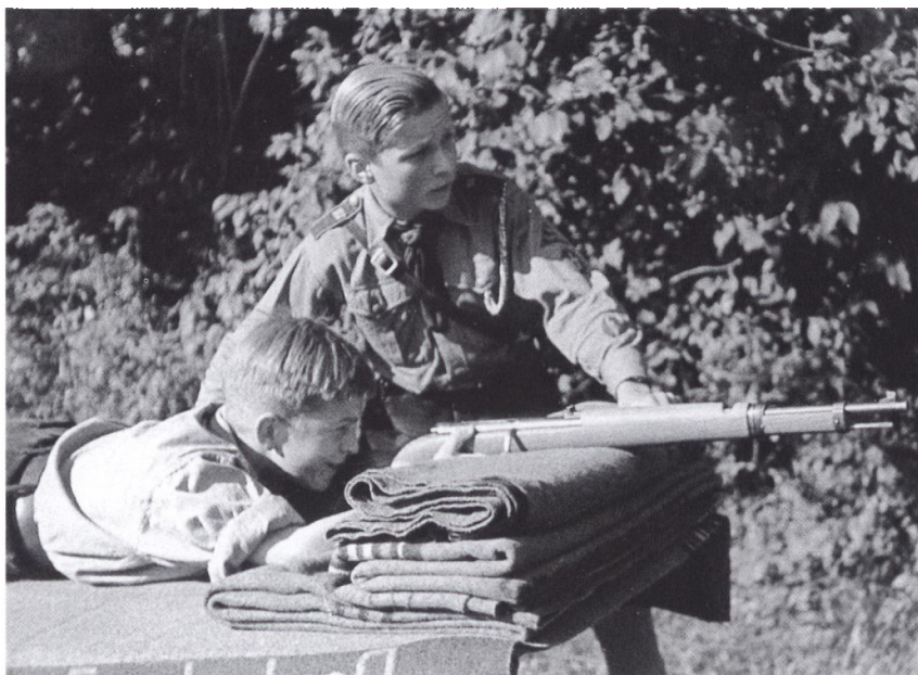
Efterligning af militære øvelser var et vigtigt led i den militære opdragelse, som her hvor unge drenge fra Tyskland i 1943 over sig i at skyde med luftgevær. Udover skydning var terrænsport og marcher et fast program i DJN's arbejde. Terrænsport var en form for militære øvelser, hvor det gjaldt om at erobre land og bekæmpe fjenden.