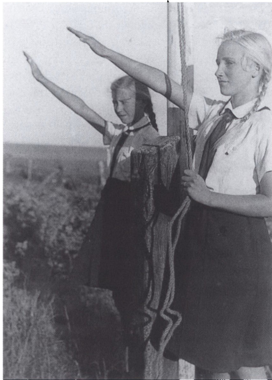
At hejse fanen var et fast program punkt ved enhver lejr, som her hvor to unge Mädchenschaftlere hejler under den nazistiske fane på en »Jungmädelführerinnenlager« i Skelde i 1943.

morgensport, appel og flaghejsning. Efter morgenmaden var der typisk forberedelse til idrætsmærket (Das Deutsche Jungenschaft-Leistungsabzeichen), eller der blev arrangeret terrænøvelser. Om aftenen kunne der være filmforevisning. I 1937 blev filmene »Das Auslandsdeutschtum« og »Das Leben und Treiben im Nordmarklager« vist, og der blev afholdt hjemaften. Som ved en rigtig soldaterlejr blev der holdt vagt døgnet rundt. Et fast element i påskelejren var et stort påskebål og en march gennem en nærliggende by. Påskelejren indeholdt også et »Thing der Jungenschaft«, hvor det kommende års arbejde blev fremlagt.