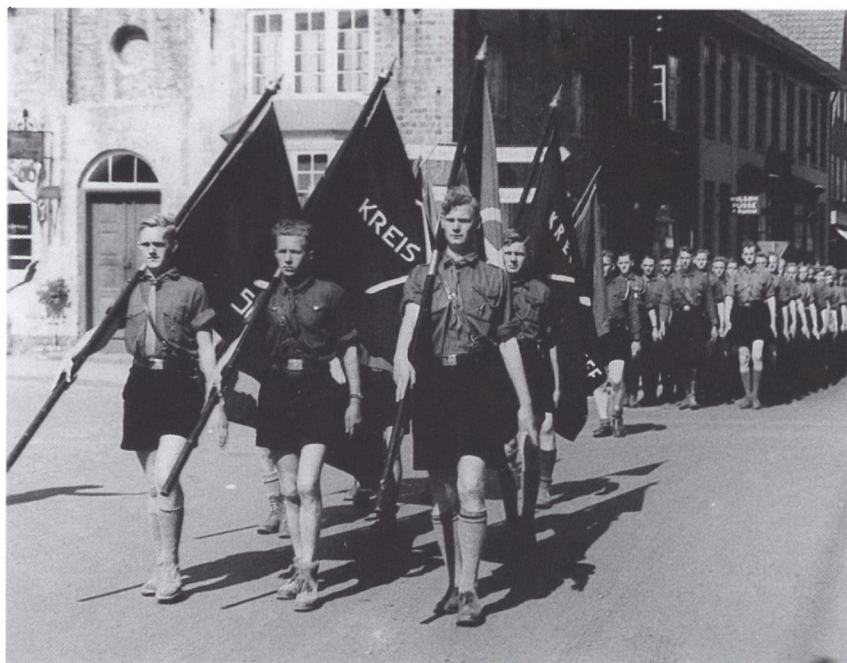
Jungenschafiler marcherer gennem Tønder. For Jungenschaft (og Mädchenschaft) var marcher en vigtig del af deres virke. Ved disse marcher blev den rette militære disciplin og holdning trænet, samtidig med at man manifesterede sig over for den dansksindede befolkningsdel. I 1939 var det officielt stadigvæk forbudt for politiske organisationer at optræde i uniform. Fra dansk side håndhævede man dog ikke forbudet under besættelsen, idet det muligvis kunne skade forholdet til Tyskland.

var tænkt som en midlertidig organisation. På lang sigt skulle hele den tyske ungdom, dvs. ungdomsforbundene, vandrehjemsarbejdet og de unge fra sportsforeningerne, sammenfattes i sammenslutningen »Jugendwerk«. Den overordnede politiske linje var nazistisk, hvilket bl.a. indebar en fælles ideologisk skoling af alle ungdomsførere.