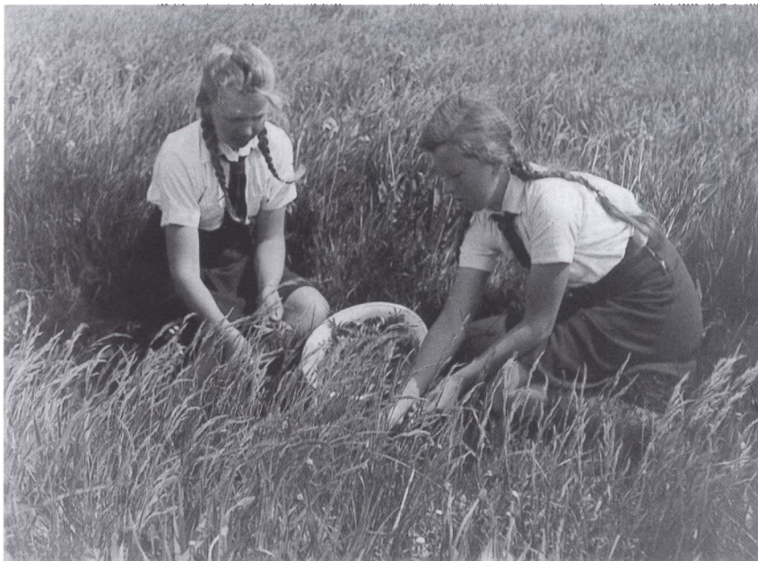
Indsamling af lægeurter i D.M.N. 1943. Hvor soldaten var idealet for drengene, var moderen idealet for pigerne. Derfor blev pigernes opdragelse lagt an på at tilegne sig huslige færdigheder, såsom at føre en husholdning, madlavning og håndarbejde. Dertil hørte også kendskab til naturens planter.

sindede landsbyungdom. Indstillingen af det daglige foreningsarbejde fik hurtigt konsekvenser: På tre år, fra 1933 til 1935, faldt medlemstallet med 900 medlemmer, hvilket betød en halvering af ungdomsforbundene.