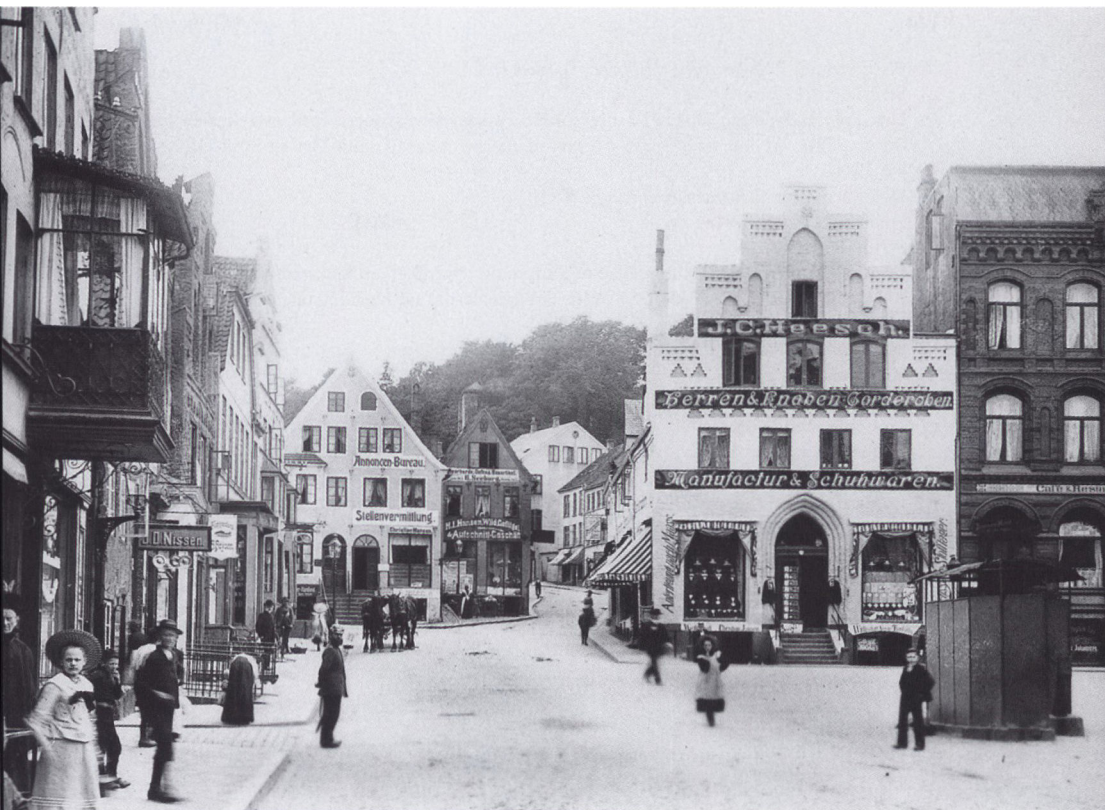
»Hjemmefronten« Flensborgere på Søndertorv kort før 1920.

tion dannede grobund for revolutionen. Den udbredte uvilje overfor statsmagten var en vigtig forudsætning for, at matrosernes og soldaternes iværksatte revolution fik den store slagkraft. Mindst ligeså vigtigt var, at staten havde tabt 'prestige' over for både de besiddende og arbejdende klasser. Selvom dette tab havde forskellige årsager, pegede utilfredsheden på den samme kilde: staten. Det er da også interessant, at netop staten var målet for revolutionen og ikke den traditionelle klassemodstander.