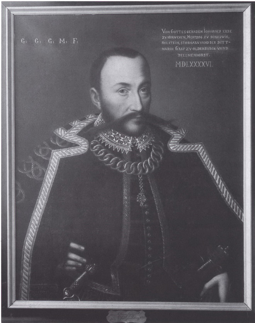
Hans den Yngre (1545-1622). På grund af sin lutherske selvforståelse havde han behov for, at kirkehøjheden fulgte landshøjheden. Behovet var så stærkt, at spørgsmålet var aktuelt for hertugen fra enke-dronningens død i 1571 til hans egen død i oktober 1622. Foto efter maleri 1596 på Glücksborg slot.

I Dorotheas testamente fra 1569 var Hans den Yngre nærmest gjort til universalarving, og det var Frederik II naturligvis utilfreds med. Reelt set blev det Hans den Yngre, som overtog hele arven, idet kongens gæld til moderen udlignedes i forbindelse med arvedelingen.