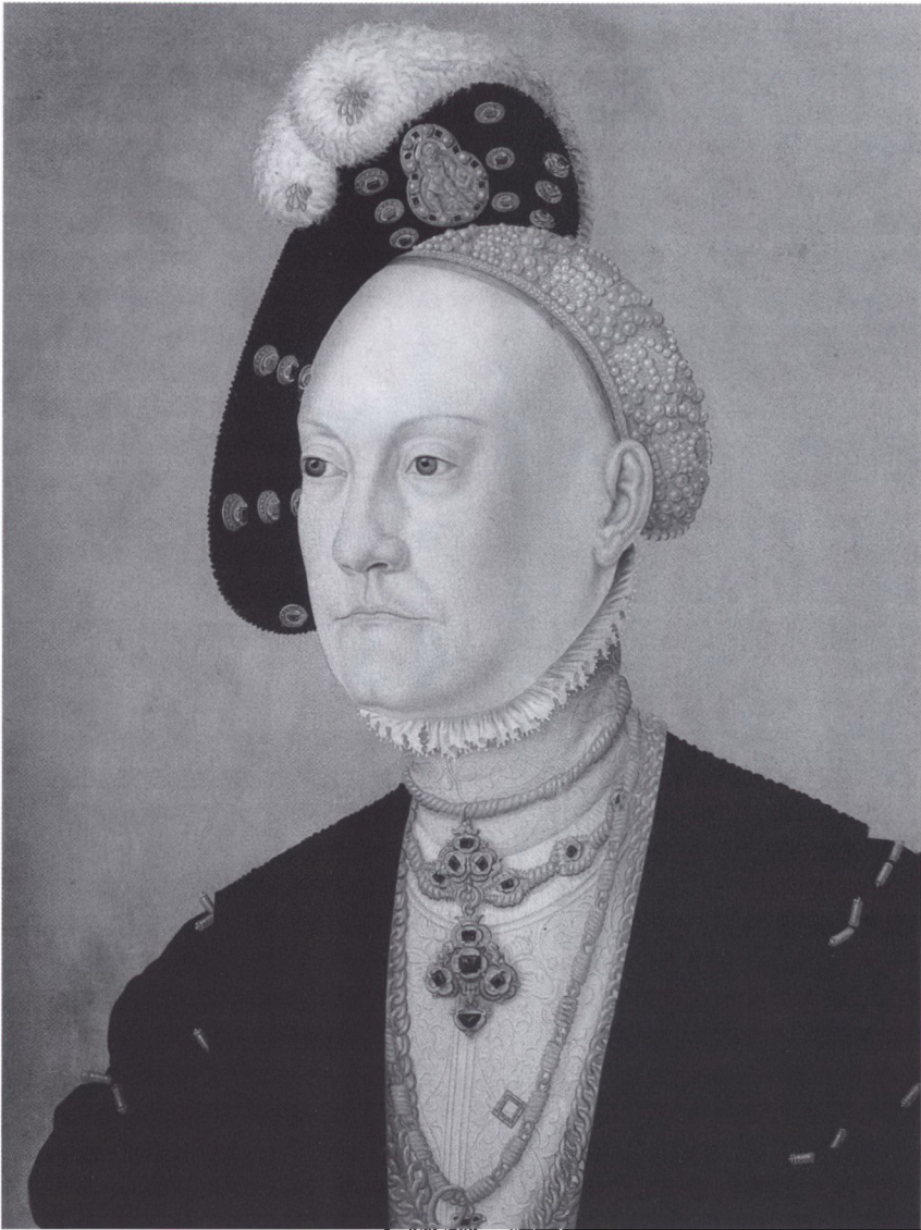
Christian III's dronning Dorothea (1511-1571) var en egenrådig dame. Hun havde en stærk luthersk tro, som dog ikke hindrede hende i at føre en håndsfast politik for at sikre yndlings sønnen Hans den Yngres fyrstelige rettigheder. Maleri på Frederiksborgmuseet, kopi efter Jacob Binck.