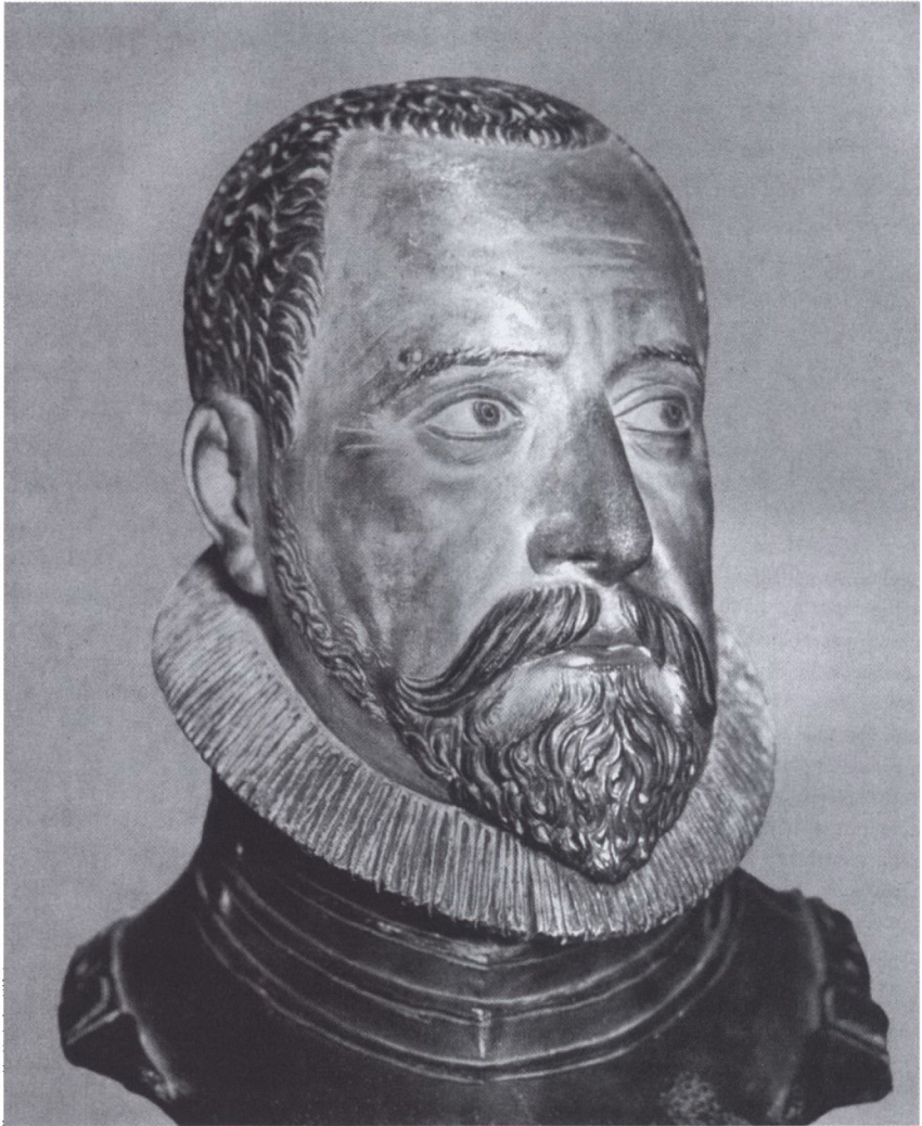
Kong Frederik II (1534-1588) stod roligt og sikkert fast på Danmarks Riges velerhvervede rettigheder, når det gjaldt den gejstlige jurisdiktion over Als og Ærø. De indrømmelser han gav, fik ikke vidtrækkende følger, men var trods alt med til at dæmpe striden i kongens sidste leveår. Bemalet buste af brændt ler. 1578. Frederiksborgmuseet.

Kilderne er påfaldende tavse angående den egentlige baggrund for den kongelige politik. Frederik II påberåber sig gang på gang sine juridiske og historiske rettigheder, men motiverer dem ikke på anden måde, end at han ikke kan tillade en forringelse af det danske riges højhed.