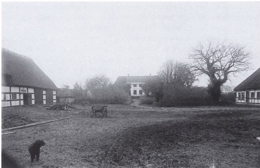
Omkring 1580 opførte Hans den Yngre Sobygaard på Ærø. Hovedbygningens stenkælder er – ligesom dele af ladegården – bevaret fra Hans den Yngres tid. Fotografi fra ca. 1910 i Ærøskøbing Kommunes Lokalhistoriske arkiv.