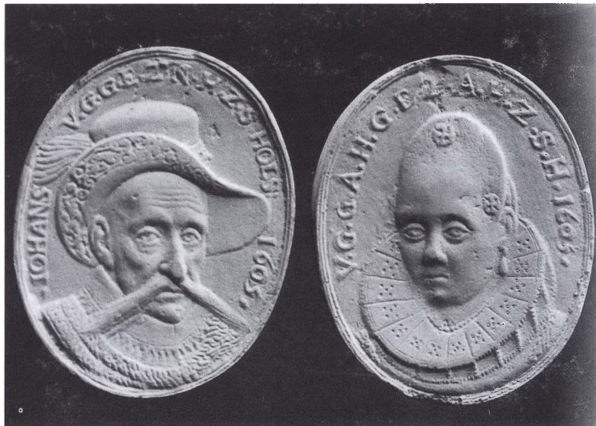
Hans den Yngre og hans anden gemalinde, Agnes Hedwig, enke efter kurfyrst August af Sachsen. Portrætmedaljer 1605.

og Ærø til sin gamle farbroder, som for egen vindings skyld lod kirkerne forfalde!