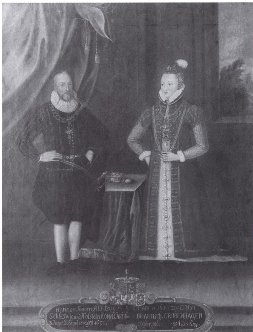
Hertug Hans den Yngre med sin første gemalinde, Elisabeth af Braunschweig-Grubenhagen. De blev viet i 1568. Hun døde 1586. Foto i Museet på Sønderborg Slot.

godset. Nu hvor enkedronningen havde anerkendt arvedelingsbrevene, var kongen tilfreds og sendte derfor sin moders skøder på godset retur. Panteskillingen på 1.800 daler måtte Dorothea også beholde, men kongen ønskede en kvittering på den og bad om at få pantegodsskøderne tilsendt. 35