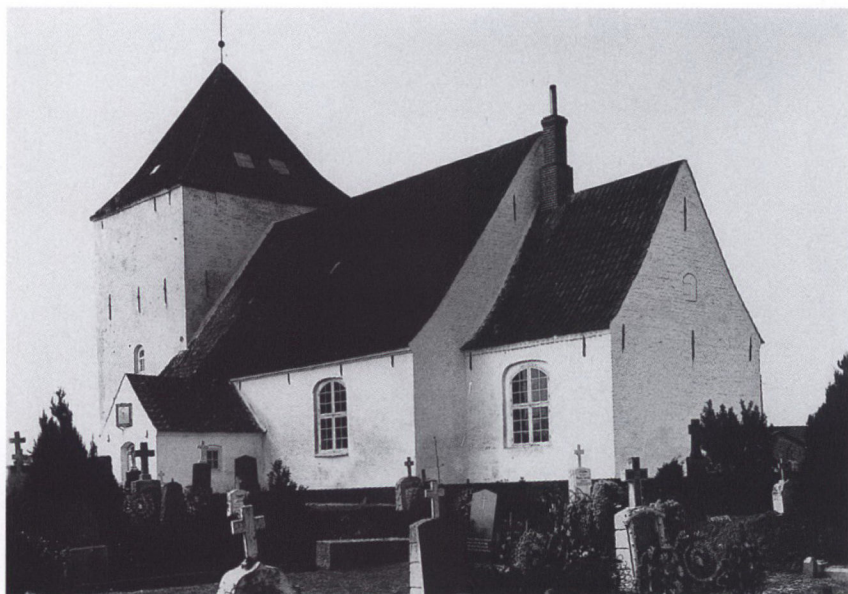
Kegnæs kirke opførtes 1615 i forbindelse med bebyggelsen af Kegnæs. Kirken er opkaldt efter Hans den Yngres navnebroder Johannes (Døberen). Nykirke på den anden side af Flensborg fjord byggedes i 1621-1622 efter de samme tegninger. Til dette byggeri bragte bønderne fra Sundeved og Als sten og tømmer sammen.