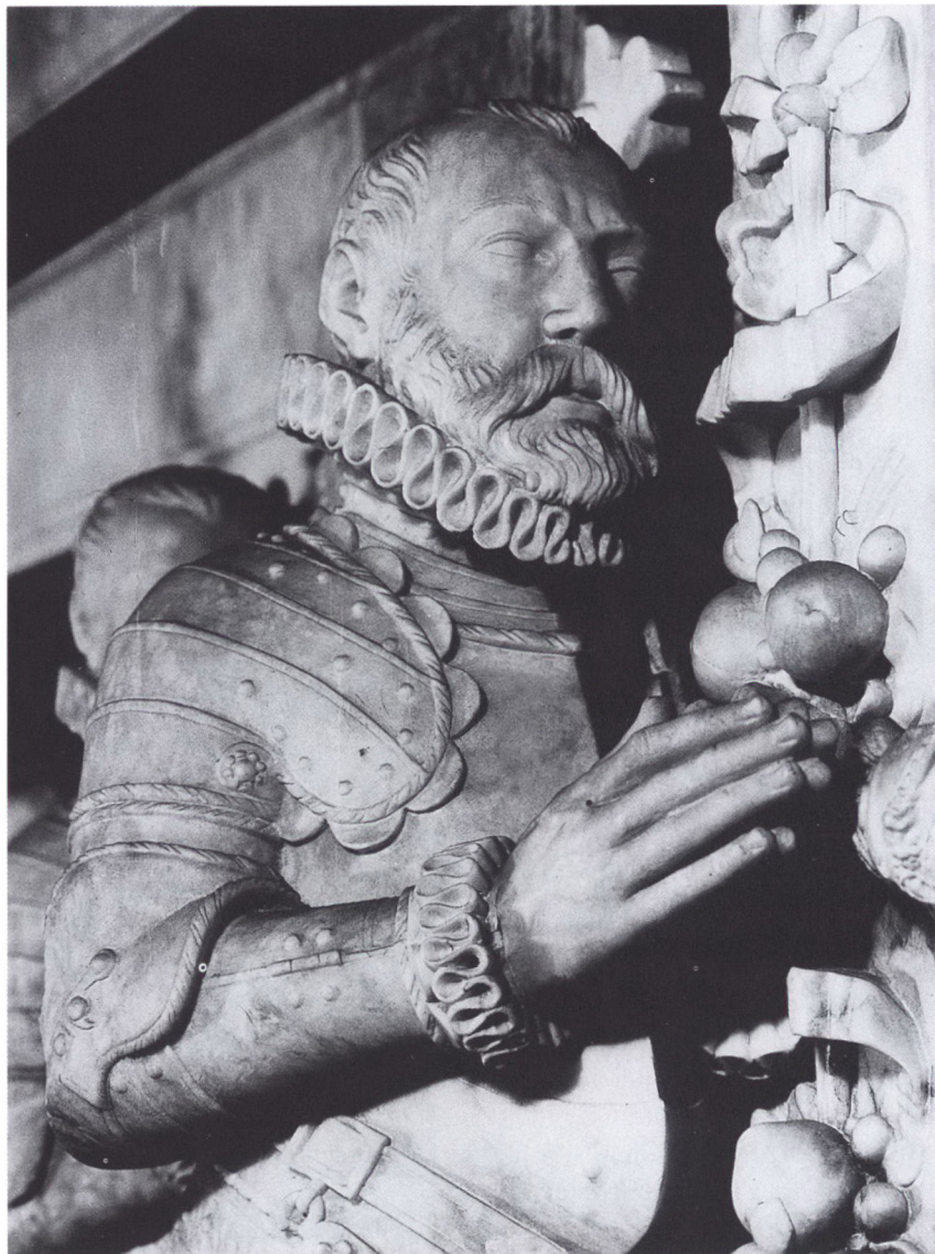
Hans den Yngre på epitafiet i slotskapellet i Sønderborg. Foto i Museet på Sønderborg Slot.

betød, at hertugerne blev stadig mere ubetydelige. Ingen anfægtede for alvor kronens ret til den gejstlige jurisdiktion på øerne. 138 Den danske kongemagts statuerede eksempel havde vist sig tilstrækkeligt!