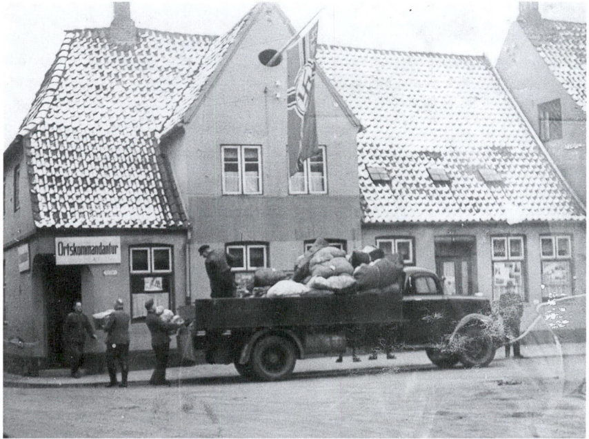
Ortskommandanturen på Storetorv, hvor de anholdte blev bragt hen. Foran huset holder en lastbil med uldvarer indsamlet af mindretallet til østfronten.

udvekslingen søndag formiddag, blev han klar over, at der var noget galt. Sin vane tro havde Tellus sovet længe, men blev brat vækket af værtens råb: »Så er det om at komme af sted«. Tellus tomlede sig til Rødekro, og derfra kom han med det først afgående tog nordpå til Horsens.