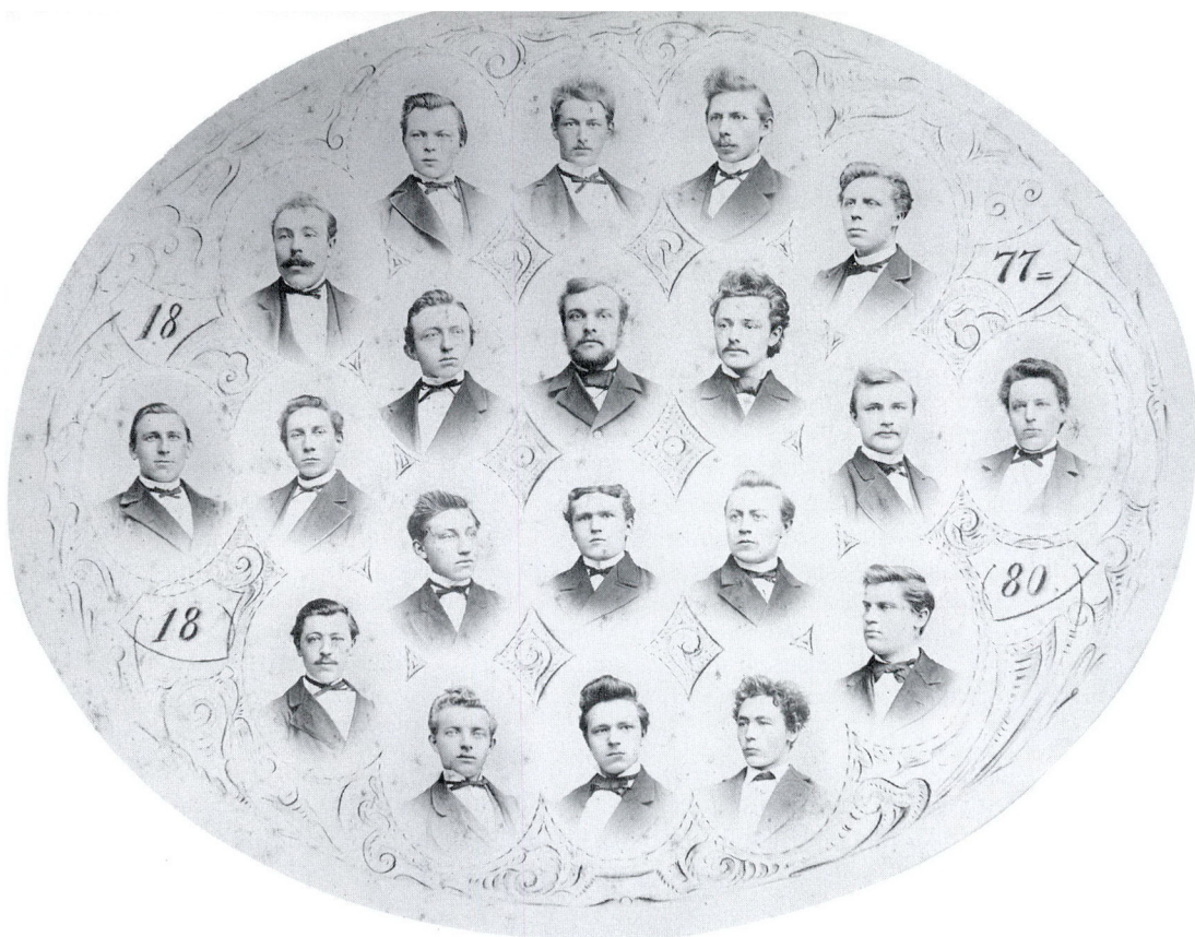
I en lang periode efter 1864 var der danskyndige blandt de sønderjyske lærere. Indtil 1884 fandtes der en dansksproget afdeling ved Tønder Seminarium. Derefter var seminariet et udpræget tysksindet sted, som mange dansksindede lærerkandidater undgik. Billedet viser dimittenderne fra den dansksprogede afdeling 1880.

klare sig. Tysksindede kunne også komme i betragtning, men de måtte ikke have opført sig bevidst provokerende over for dansksindede. Anderledes med lærerstillinger.