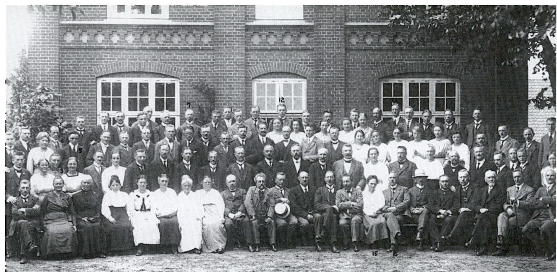
De fleste af de sønderjyske lærere, der beholdt deres stillinger i 1920, havde behov for at få udvidet deres kendskab til dansk sprog, litteratur og historie. Ikke alle nåede at komme på kursus inden Genforeningen, men i de følgende år kom der nye chancer. Det gengivne foto bærer følgende påskrift: Nordslesvigske Lærere og Lærere til Omskolingskursus i Silkeborg 1921.

Spørgsmålet om kursus i dansk blev omtalt i mange ansøgninger fra ikke-kongerigske lærere. Nogle henviste til, at de allerede havde været på kursus og derfor nu bedre kunne undervise på dansk, andre, at de gerne ville deltage i danskundervisning, og endelig var der en del, der samtidig med deres ansøgning om job anmodede om at deltage i kursus. I Det Sønderjyske Ministeriums arkiv ligger en halv pakke med sådanne kursusansøgninger. 39 Ministeriet betegnede dog, at det ikke var en betingelse for at blive ansat, at de sønderjyske lærere havde deltaget i kursus. 40