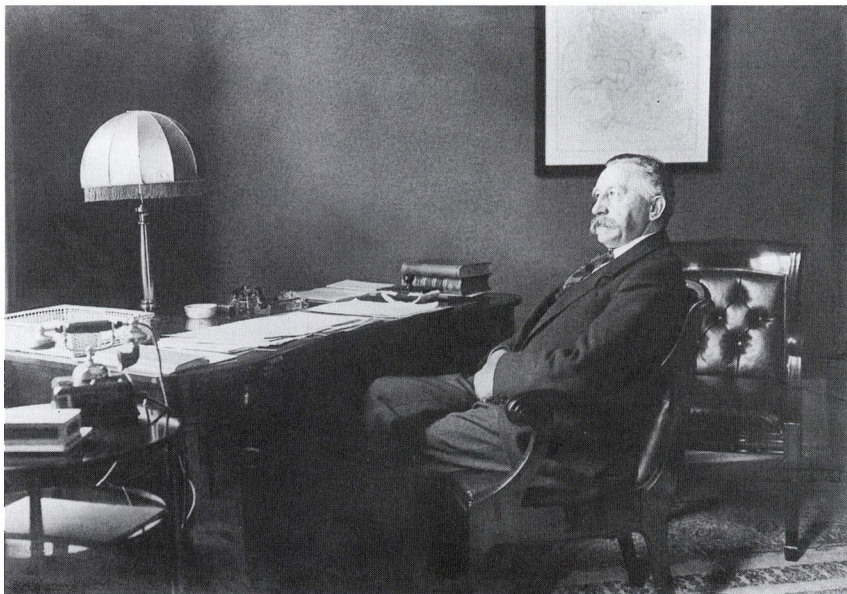
Det Sønderjyske Ministerium fik bopæl i Niels Juels Gade 3, ikke langt fra Slotsholmen. Billedet af H.P. Hanssen på sit ministerkontor er fra 1919. Som eneste udsmykning på væggen ses et kort over hele hertugdømmet Slesvig.