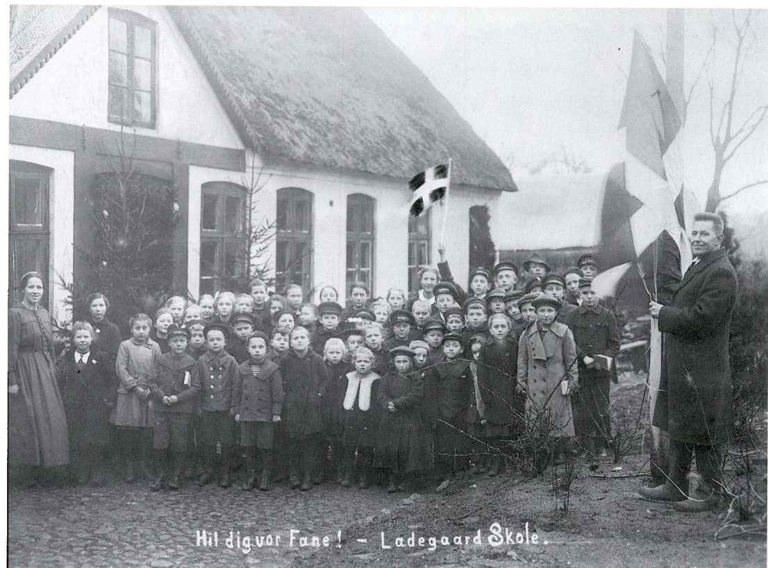
Efter 1920 var flagstang og Dannebrog standardudstyr ved de sønderjyske skoler. I foråret 1920 samlede skolebørnene i Danmark penge ind til flagene ved at sælge bomærker med sønderjyske motiver. På billedet hejses flaget ved Ladegaard Skole i Hammelev sogn.

meget vægt på, at de ledige embeder i Sønderjylland kunne besættes midlertidigt, »da det vil medføre megen Demoralisation, hvis Skolegangen gaar i Staa«. Derfor måtte man give de tilkaldte lærere ordentlige betingelser. Problemet kunne løses, hvis de danske lærere fik lov til at bestyre deres nuværende embeder ved hjælp af vikar, indtil det blev afgjort, om de pågældende fik fast ansættelse i Sønderjylland. De skulle så indtil da beholde deres fulde løn og pensionsret med fradrag af vikarlønnen, samtidig med at de fik løn fra embedet i Sønderjylland. Undervisningsministeriet accepterede SØM's forslag på betingelse af, at lærerens vikar blev godkendt af skoledirektionen. 52 SØM orienterede Skoleudvalget om de nye regler, som også blev offentliggjort i »Folkeskolen«. 53