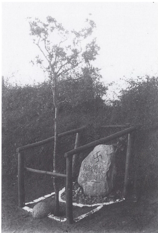
Nazificeringen antog mange former. I 1933 blev der plantet »Hitler-Eichen«. I Langbjerg øst for Medelby blev træet plantet 1. maj 1933 og det blev markeret med en mindesten.