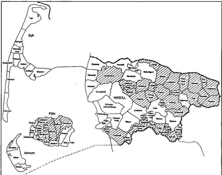
I Sydtønder amt opnåede N.S.D.A.P. massiv tilslutning ved rigsdagsvalget 31. juli 1932. Medelby hørte til den lange række af valgdistrikter, hvor nazipartiet opnåede over 85% af stemmerne (her skraveret). Gengivet efter Wilhelm Koops: Südtöndern in der Zeit der Weimarer Republik , 1993, s. 386.

I 1933 var egnens politiske landskab lige så uvarieret. Provinsen Slesvig-Holsten var det område i Tyskland, hvor N.S.D.A.P. først opnåede det absolutte flertal af stemmerne ved et frit valg. Den brune bølge var især stærk i midtlandet, og dens skvulp nåede helt op til Medelby sogn. Ved rigsdagsvalget i juli 1932 fik N.S.D.A.P. 37% af stemmerne i Tyskland som helhed, men 51% i Slesvig-Holsten og 65% i Sydtønder kreds. Inden for kredsens havde