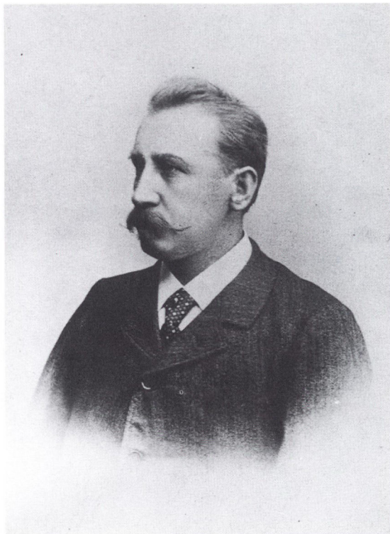
H. P. Hanssen (1862-1936) i 30-års alderen.

et større sold; Harmonien blev overvåget udefra, men det lykkedes ikke for politiet at finde et påskud til at gribe ind.