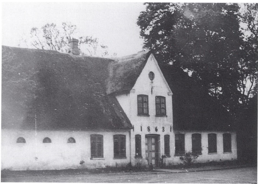
Degneboligen i Brede, der var opført 1863, blev nedbrudt 1964 for at give plads til den nye præstegård. Foruden et rummeligt stråtekt stuehus var der en mindre stald til en hest og et par køer. Bemærk de karakteristiske halvmåneformede vinduer i stalden.