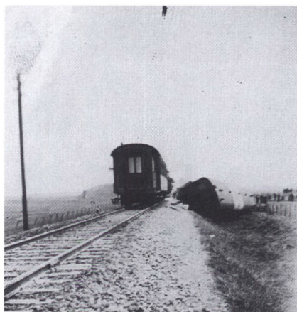
Afsporingen af et tysk lazarettog den 15. april 1945 var effektiv og holdt jernbanelinien lukket i lidt over 30 timer.

Den voldsomme aktivitet i disse dage gav anledning til, at Gestapo begyndte at interessere sig lidt for meget for Døstrup, og en dag gik der i Skærbæk