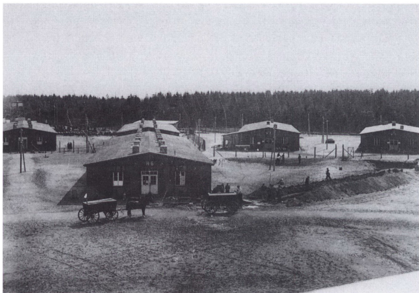
Fårhuslejren kort efter kapitulationen, inden fængselsvæsenet havde overtaget driften.

fremtidige arbejde ridset op. Mødet i Audebo var forjættende. Det startede under det fanfarelydende motto: Højskolen ind i fænglerne, og vi, de ny fængselslærere, begav os opløftede ud til de enkelte tjenestesteder med en god fornemmelse af, at et meningsfuldt pionerarbejde ventede os.