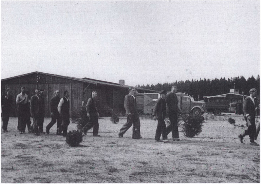
Internerede i Fårhuslejren 1945. Billedet er taget før efteråret 1945, da fængselsvæsenet overtog driften.

øvrigte. Det bestod overvejende af akademikere, jurister, historikere, journalister fra »Fædrelandet« og fra den tyskkontrollerede radio m.v. 1 Et par af dem havde været medlemmer af det nazistiske storråd. Ingen af deltagerne havde ønsket elementærundervisning, men alle var opsat på at diskutere alment kulturelle og politiske emner.