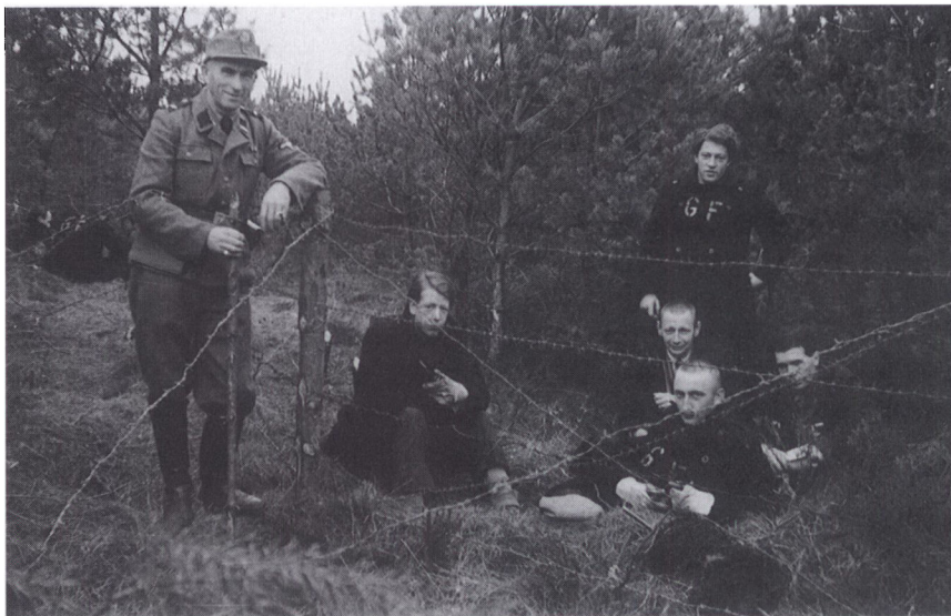
En gruppe Frøslevfanger er udkommanderet til at trække pigtråd i plantagen uden for lejren. Bemærk det påtrykte »GF« på fangernes arbejdstøj. Det stod for »Gefangenelager Frøslev«.

Jeg var mellem de sidste fanger, der forlod transportskibet. De få tyskere, der stod ved kajen, da vi lagde til, og som havde råbt ukvemsord efter os, var forlængst gået hjem.