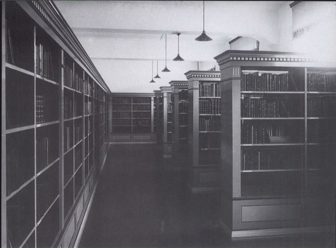
Det viste sig hurtigt, at lokalerne på »Folkehjem« ikke var ideelle til biblioteksbrug. I 1922 stillede Aabenraa by derfor en bygning i Rådhusgangen til rådighed, og her kunne »Det sønderjyske Landsbibliotek« tage nye lokaler i brug den 1. januar 1923. På billedet til venstre ses læsesalen, herover udlånet.

af offentlige biblioteker, men foretrækker at have biblioteker sydfra undtagne den danske stats kontrol, turde det ikke være helt udenfor mulighedernes grænse, at de i sogne, hvor sognerådet eller skolekommissionen har tysk flertal, kunne ville nægte tilladelse til eller lægge hindringer i vejen for de danske bibliotekers anbringelse i skolerne eller i hvert tilfælde kræve, at i så fald indsatte også de deres biblioteker i skolerne eller i de tyske afdelinger af dem.