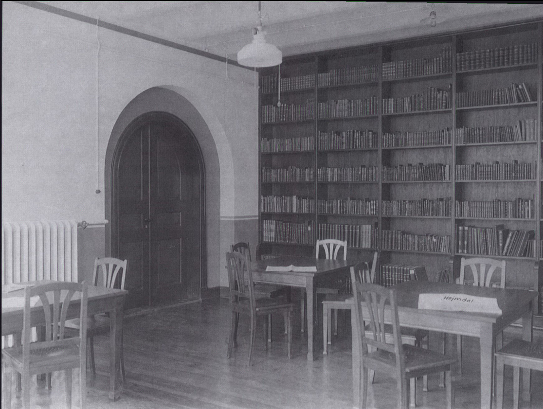
Biblioteket på Folkehjem – læsesalen fotograferet 1921. Historiske Samlinger for Sønderjylland.

avisdyrkere ude i byen; dette spørgsmål vil blive løst i forbindelse med spørgsmålet om museet, et udvalg skal nedsættes derom, H. P. have sæde deri, og bibliotekssagen vil deri blive fremholdt; inden efteråret vil dette sikkert være ordnet.