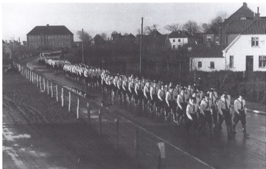
Uniformerede medlemmer af Schleswigsche Kameradschaft og Deutsche Jungenschaft Nordschleswig marcherer her den 29. november 1942 gennem Graasten for at markere indvielsen af den nye tyske skole, som ses i baggrunden. Den imponerende bygning var finansieret ved direkte træk på besættelsesmagtens konto i Nationalbanken. Efter krigen blev bygningen beslaglagt, og politiet tog den i brug som politigård.