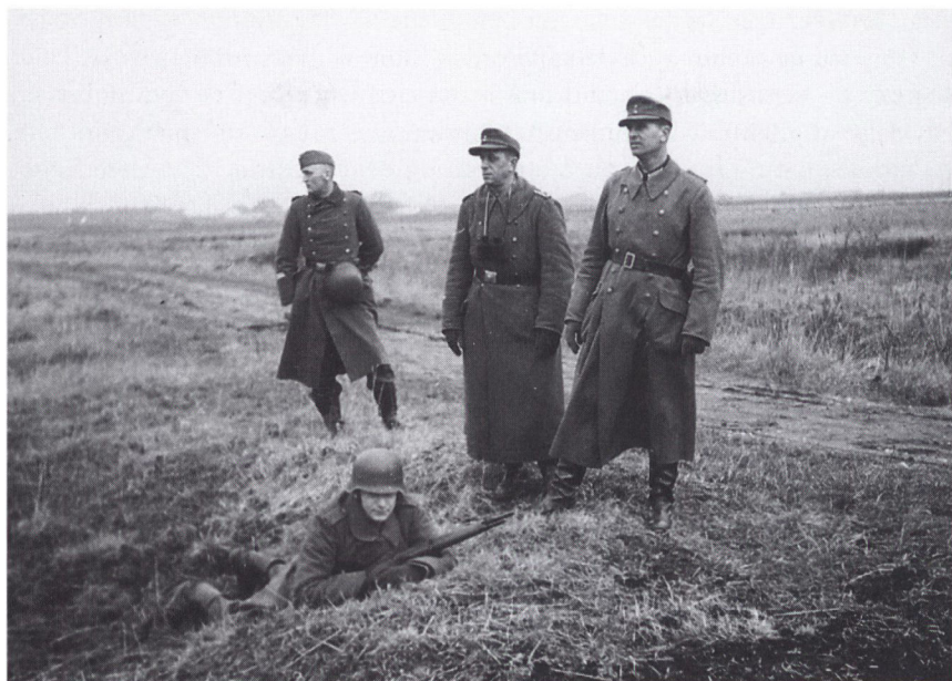
Zeitfreiwillige i aktion.