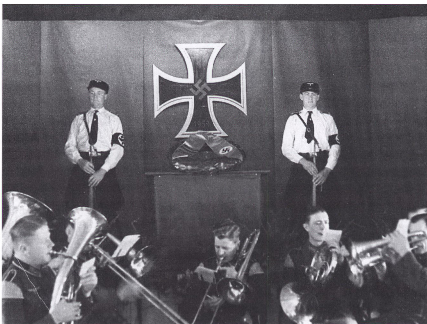
Mindretallet mistede mange medlemmer ved fronten. Hjemme blev der holdt mindehøjtideligheder på tysk »Helden-Ehrung«. Foto 1943 i Historiske Samlinger, Aabenraa.