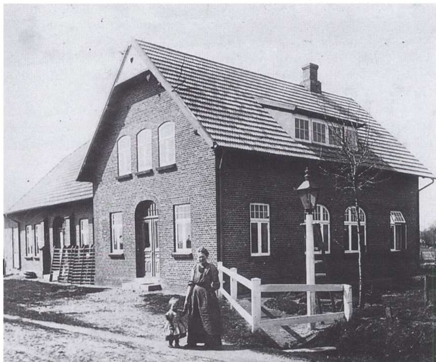
Mange forsamlingshuse har i årenes løb fået støtte fra H. P. Hanssens Mindefond, også forsamlingshuset i Brede. Huset blev opført i 1907 og senere udvidet flere gange.

tilskud, og man har ønsket oplysninger om husenes brug til f.eks. møder, lokale generalforsamlinger, gymnastik, amatørteater m.v.