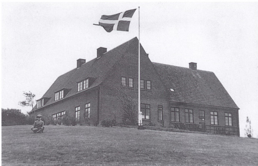
Villaen Bramshjerg er netop bygget, og haven nyanlagt. Foto 1936.