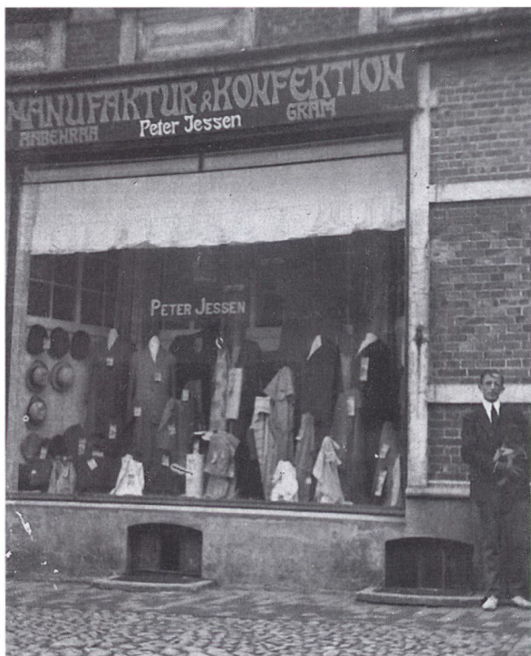
Filialen i Gram fra 1919 til 1926 havde ét vindue til Slotsvej. Fra 1. sal var der udsigt over slotsparken.

Den mest påtrængende opgave var dog at fremskaffe varer til den tomme butik. Kundernes behov var stort efter de fire trange krigsår, hvor fornyelse af tøj og af hjemmets tekstiler kun i ringe omfang havde været mulig. Anmodningen om vareleverancer afgik i første omgang til de traditionelle tyske leverandører, men efterhånden som genforeningen nærmede sig, orienterede