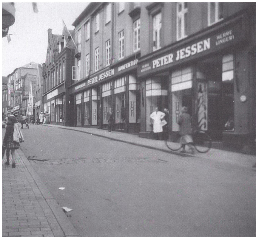
Forretningen set sydfra i 1951. Helt tilbage i billedet ses de nye udstillingslokaler, der netop er taget i brug.