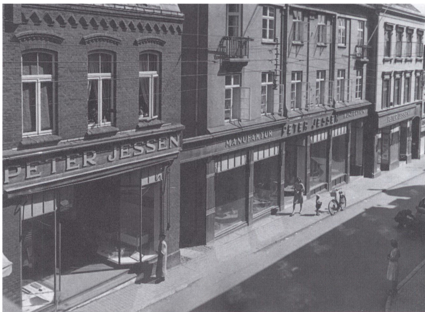
Forretningens facade fotograferet under besættelsen. Til venstre de lejede lokaler i Storegade 15. Derefter følger hovedbygningen, hvis facade svarer til den oprindelige fra 1923. Til højre Storegade 19, hvor herre- og drengeafdelingen havde til huse. På gaden helt til højre ses en tysk soldat, der er ved at reparere sin bil.

kunder, hvilket medførte en stærk vækst i salget. I 1939 nåede salget knap 1 mio. kroner. I 1947 blev det på 2.7 mio. kroner og i 1949 3.2 mio kroner.