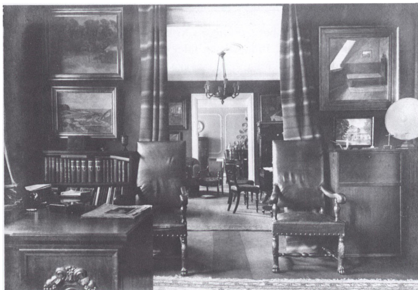
To billeder fra købmandens lejlighed på Storegade 17. Øverst herreværelset med de tunge egetræsmøbler. Til venstre tobaksskabet med de gode cigarer og på væggen maleren Petersen Stubbæks portrætter af sønnerne, fra venstre Erik, Olaf og Johan. Nederst et kig gennem alle tre stuer. Forrest herreværelset. Skabet til højre gemte en radio med højtaler. Dameværelset i midten, også kaldet dagligstuen, var møbleret med mahognimøbler. Spisestuen skimtes bagest. Møblerne var af lyst birketræ, og der kunne dækkes til 24, hvis man sad tæt til 30.