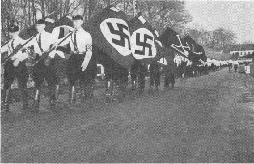
S. K. paa March gennem Graasten 29./11. 1942.