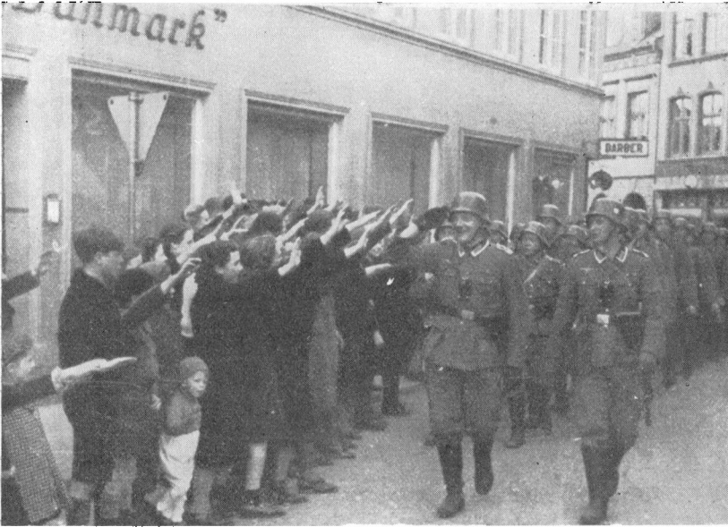
Hjertelig tysk Modtagelse i Aabenraa.