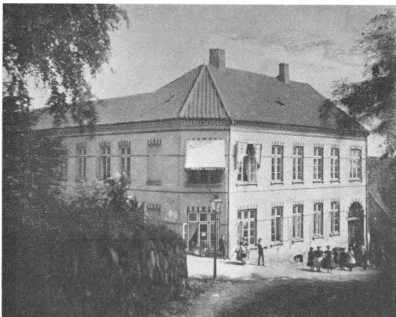
C. F. Monrads Skole i Flensborg

at bringe Folk vore Meninger paa Tysk og derved saa godt som aldeles udelukke dem fra enhver levende Berøring med det danske Sprog. Endnu værre var det med Omegnen, hvor Dansk endnu er Folkesprog, og hvor Fl. Anzeiger naturligvis daglig paa det sproglige Omraade arbejdede vore Fjender paa det