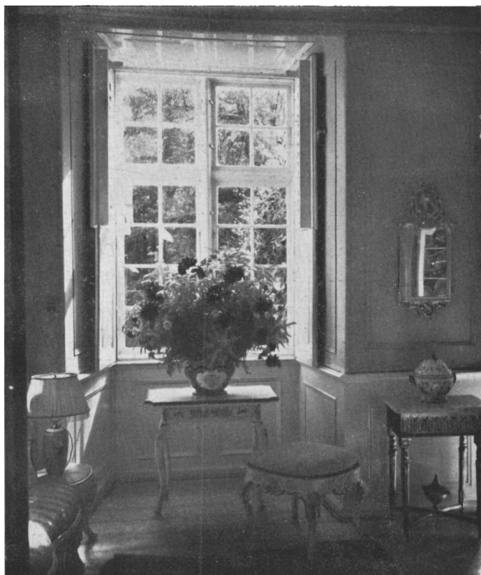
I det nuværende Schackenborg er der adskillige rester tilbage af det gamle Møgeltønderhus. I sydfløjen står saledes endnu Møgeltønderhus' solide mure, hvis tykkelse billedet giver et indtryk af.