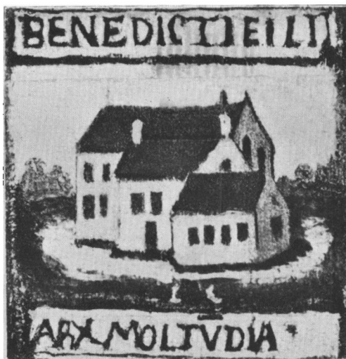
Den rantzause tavles gengivelse af Møgeltønderhus (efter Vilh. Lorenzen: Rantzause Borge og Herregaarde i 18. Aarhundrede. Kbhvn. 1912).