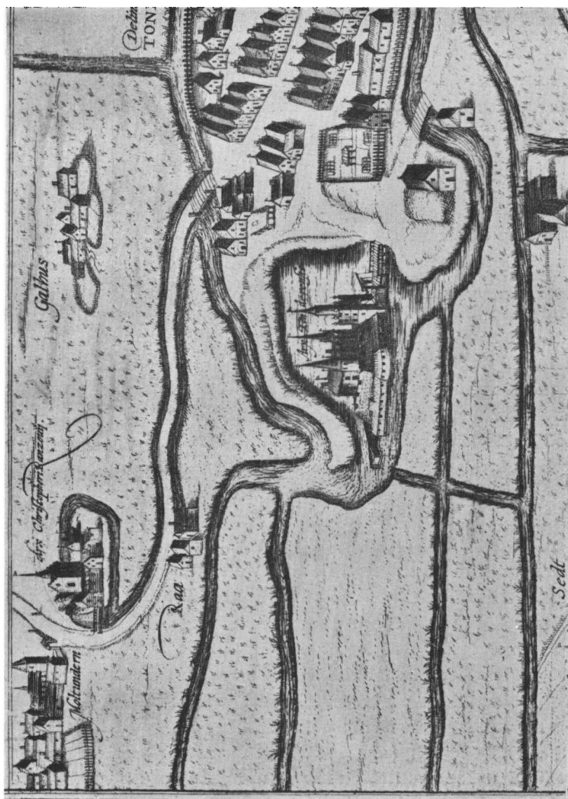
Møgeltonderhus og omegn 1588. Udsnit af Brauns stik over Tønder og omegn i Theatrum Urbium V.