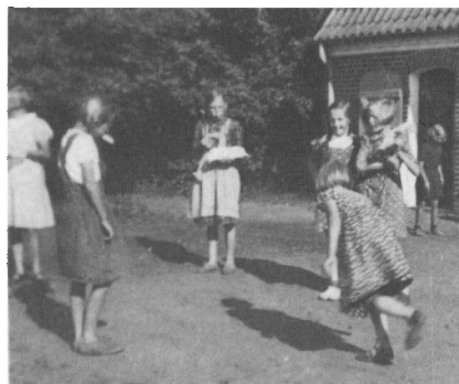
Pigerne hopper i paradiset