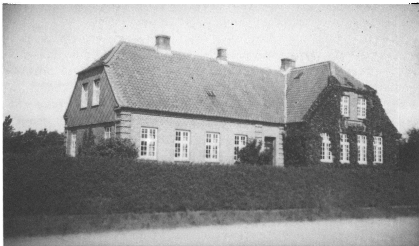
Skovhuse skole. De to klasseværelser lå til højre, lærerens bolig i længen til venstre. Skolerne i Skovhuse og Bevtoft (side 254) lignede hinanden meget på trods af, at den ene var bygget før Genforeningen i 1912, den anden i 1927 – begge i »Bedre Byggeskik« – »Heimatschutz«-stilen!

foretaget en udstykning af nogle af godsets jorder, og 27 nye husmandsbrug blev oprettet. Gennem gamle dokumenter havde man fået god besked om den gamle landsby, Skovhuse, og den nye bebyggelse fik derfor navnet Skovhuse.