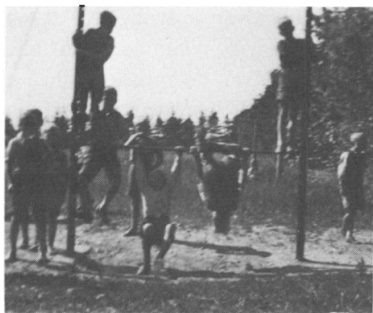
Drengene i bommen

Pigerne hørte man aldrig drille hinanden indbyrdes. De legede lige godt sammen, enten de var kloge eller ej, enten de var velklædte eller dårligt klædte. Jeg undrede mig over, så lidt standsforskel de viste. Når man har set, hvorledes