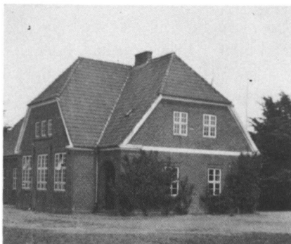
Bevtoft skole fotograferet af Anna Schrøder i 1940.