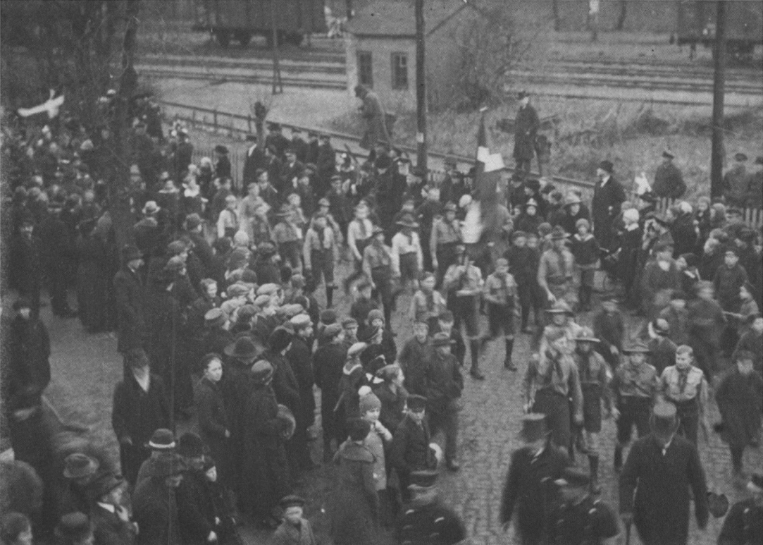
Spejderne på vej fra banegården i Aabenraa mod Nørreport i spidsen for danske vælgere, ankommet med tog, for at deltage i afstemningen den 10. februar 1920. Forrest ses to medlemmer af modtagelseskomiteen iført høje hatte.

selvkomponeret «generalsuniform» med gule knapper og efterhånden forsynet med så mange årsstjerner, at han måtte have været spejder siden sin fødsel«. Der var jo nogle, der brugte spejderbevægelsen, i dens første år, til at få afløb for bristede drømme om en højere militær karriere.