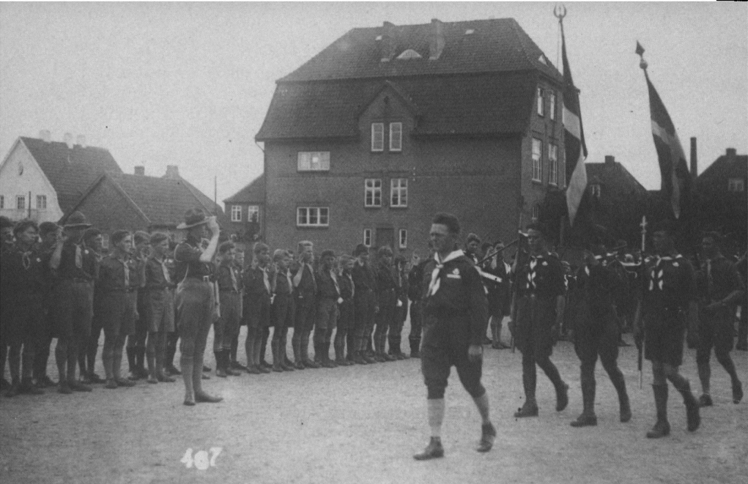
Ved spejdernes parader førtes Dannebrog til fløjen. Her er det to Dannebrogspaner under ledsagelse af to væbnere med stave prydet med spejdertilje og rød/hvide bånd. Det skete almindeligvis til tonerne af »Her kommer Jens med fanen.« Her på statskolens plads i 1928