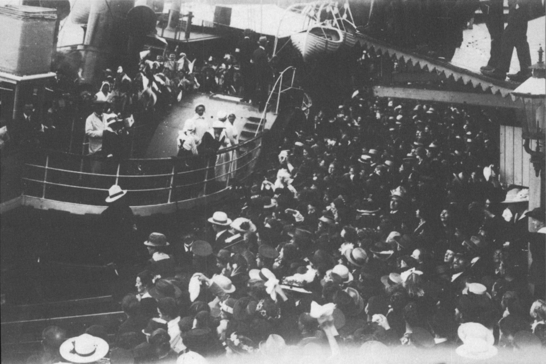
Mødre vinker farvel til børnene på »feriebørnsskibet« Ægir den 22. juni 1919.