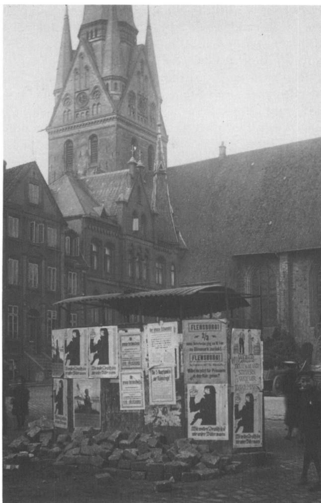
Valgplakater på Søndertorv i Flensborg forud for afstemningen den 14. marts 1920. Dansk Centralbibliotek for Sydslesvig.

danskerne nu var ude på at udplyndre et besejret og efter krigen svækket folk og fratage det dets retmæssige og nedarvede ejendomsret.