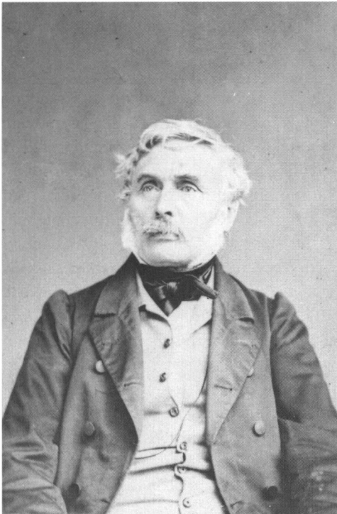
Oberst A.F. Tscherning (1795-1874), krigsminister i 1848