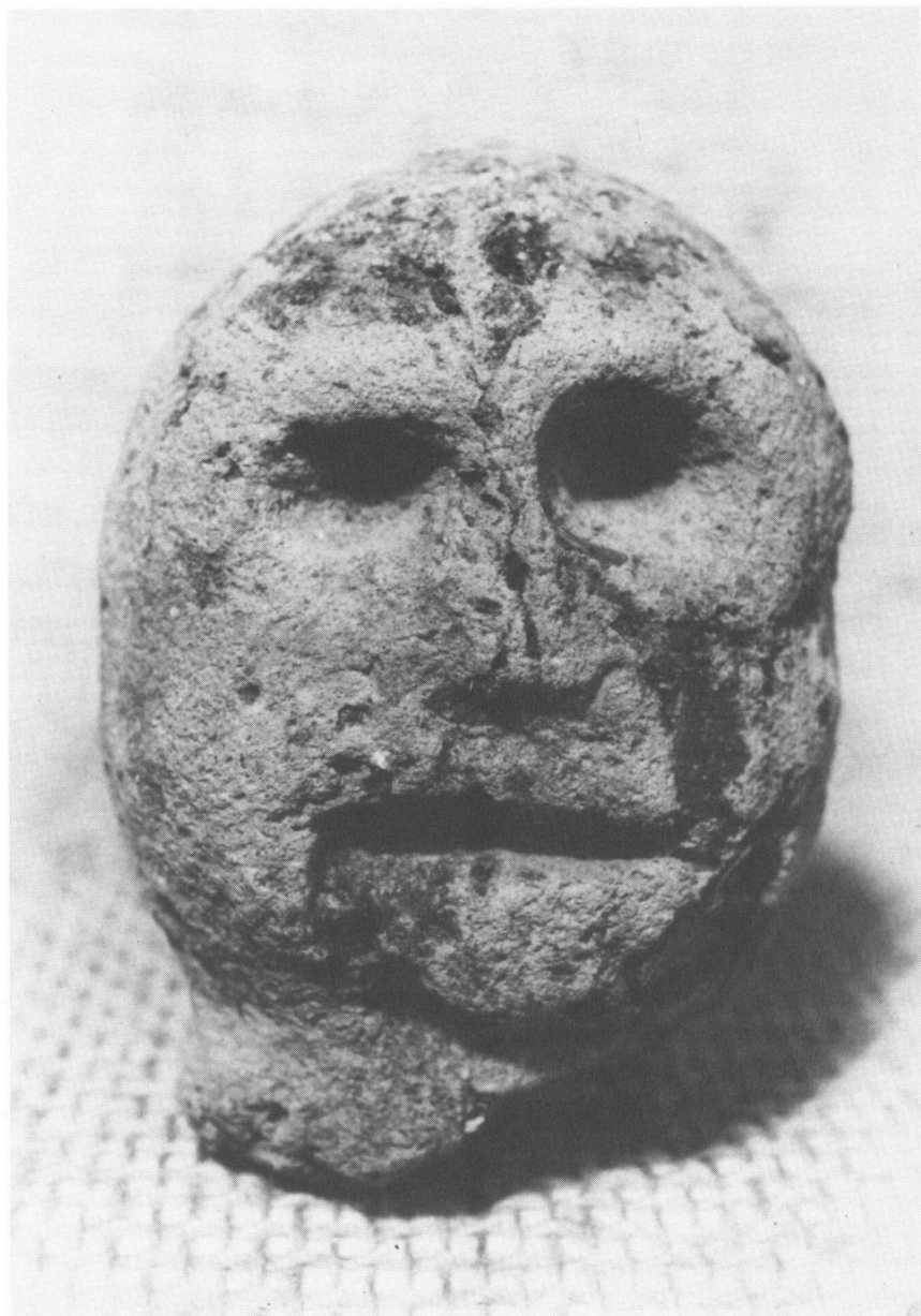
»Arrild-mandens«. Et godt 8 cm højt ansigt i hårdtbrændt ler, fundet i udgravningen 1976.