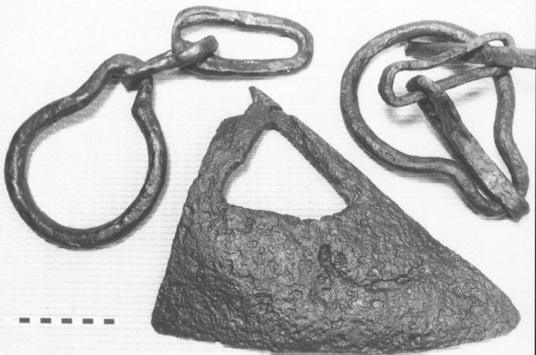
Plovskår og plovkæder fundet på den østlige forborg i henholdsvis 1977 og 1980. Plovskåret har siddet monteret vandret med den hvælvede side opad, som på billedet, idet man skal forestille sig ploven kørende fra venstre mod højre. Skåret lå ovenpå den korte del af den naturligt krumvoksede sule, hvis lange del foroven var fastgjort i plovens ås. Med en tap (bemærk brudfladen foroven, til venstre) var skåret fastgjort til et hul i sulen, boret ind netop hvor denne krummede.

ring på hver side af mulen. Heri fastgjordes tøjlen. Denne type bid benyttedes hele middelalderen og anvendes såmænd stadig. Fem hjulsporer er repræsenteret i materialet. Denne sporetype bliver næsten enerådende i 1300-tallet, og skønt hjulet med de mange spidse pigge umiddelbart ser farlig ud, blev det faktisk indført for at beskytte hesten. Ved en utilsigtet berøring med hestens side vil hjulet blot dreje rundt i stedet for at flænge hesten. Enestående er fundet af to stykker læder, der med al sandsynlighed stammer fra en saddel . Det drejer sig om to læderstykker, hvis udskæring antyder, at de har fungeret som beklædning på sadlens træsæde.