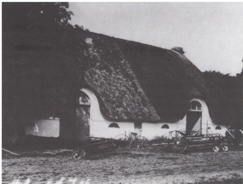
Det vældige stråtag på Grøngårds gamle lade kronedes af storkereden.