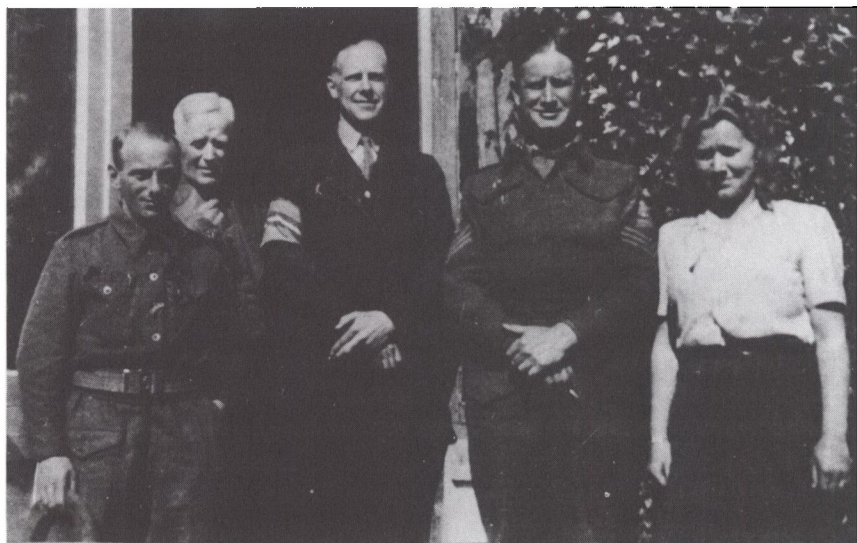
De første englændere på Grøngård, Kristi Himmelfartsdag 1945.