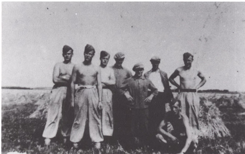
Gardere på høstarbejde på Grøngård i 1945.