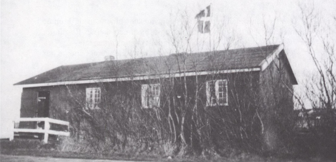
»Danmarks mindste forsamlingshus« i Lydersholm.