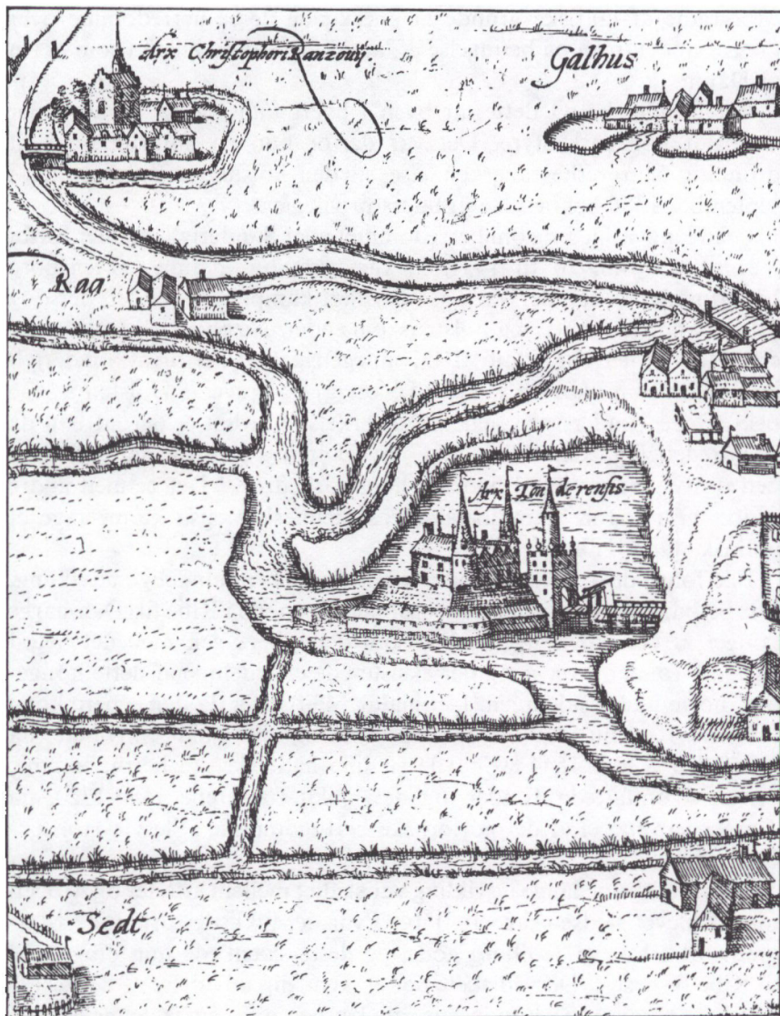
Møgeltønderhus og Tønderhus efter stik i Braunius og Hogenbergs Städtebuch fra 1588. Når Møgeltønderhus er mindre på dette stik, skyldes det et forsøg på at vise afstanden fra Tønder.