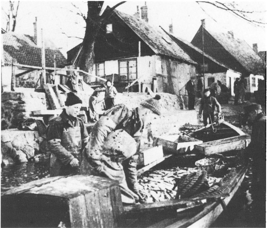
Fisk landes ved Nienstadt på fiskerlejet Holmen i Slesvig. Ca. 1950.

for nogle af dem endda så gode, at de købte sig et klaver. Fiskerne i Slesvig kaldte således i 20'erne Norderholmstraße for »de Klaverstraat«, på dansk: Klavergaden. De to eller tre vodfiskere, som havde et klaver, kunne dog ikke spille på det.