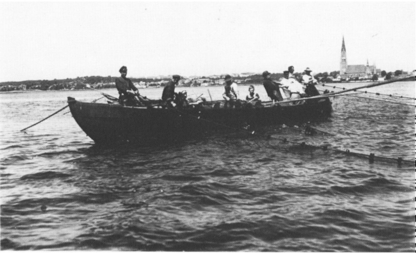
Vodfællesskab af Slesvig-fiskere trækker vod i land. Ca. 1935.

småfiskernes fiskekurve og åluser. Derpå anklagede de kommunernes småfiskere for ulovligt fiskeri, som til gengæld anklagede slesvigerne for tyveri.