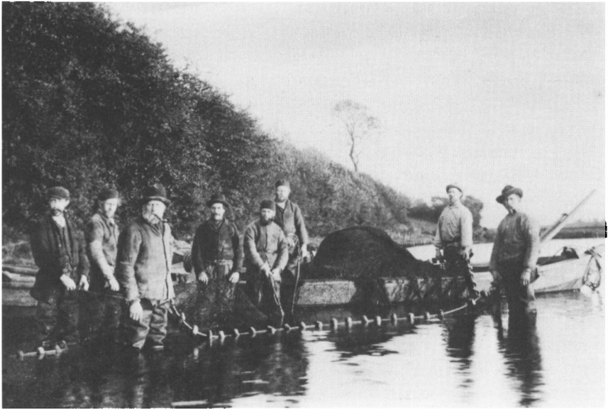
I Arnæs fandtes o. 1900–1910 kun ét vodfællesskab, som fiskede med vod (drivgarn) og som levede af fiskeriet. Langt de fleste Arnæs-fiskere fiskede dog småt med net (sættegarn) eller snører. Deres fiskeri drev de som bierhverv. Ca. 1910.

nedgangen i Arnæs' skibsfart og den begyndende afmonopolisering af sildefiskeriet på Slien. Støttet af de større skippere, der så en økonomisk fordel i sildefiskeriet, fik dette de mindre Arnæs-skipperne til at starte et net- og vodfiskeri på Slien. Det satte dem i et modsætningsforhold til fiskerlavet i Slesvig, som trods alt stadig beherskede markedet. Lavet gjorde alt for at hindre, at Arnæs-skipperne gjorde indhug i dets indtægter og deraf følgende lokale magtstilling. Silden udgjorde lavets magtgrundlag. Også fiskerlavet i Kappel reagerede imod, at der i Arnæs-skipperne voksede en ny konkurrent frem.