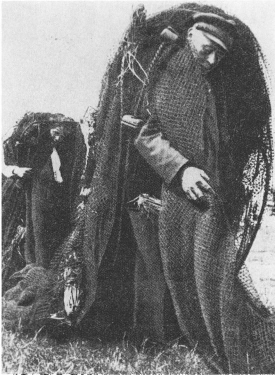
Voddet slæbes fra nettørrepladsen Friheden ned til bådene ved Slien. Ca. 1920–1930.

endda så vidt som til at lægge sig på lur, såsnart Binebæk-fiskerne var i syne og så starte fiskeriet, når de nærmede sig. En konfrontation var uundgåelig.