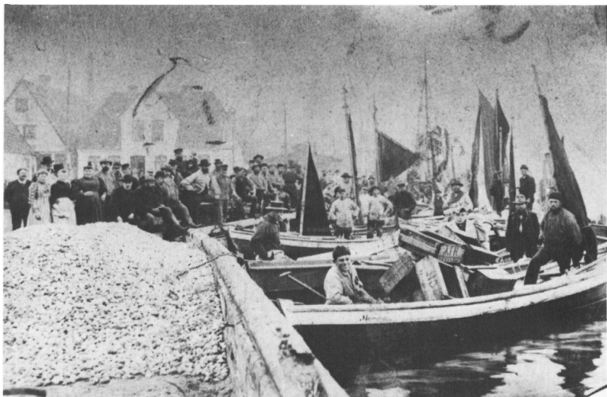
Kappels småfiskere, som ses her, fiskede kun med net. Ca. 1880.

amtmanden fortsatte med at udstede bøder og forbud mod arnæsserne, og overretten med at ophæve dem. Frem til 1865 gik striden dog også ud over de førhen så kapitalstærke større og mindre Arnæs-skipperne, som mere og mere skiftede over til fiskeriet. Ret beset var striden mellem vodfiskerne i Slesvig og skipperne i Arnæs ikke andet end en kamp for at bevare hver deres rolle som stærke lokale økonomiske faktorer, og i den havde de begge lidt økonomiske tab.