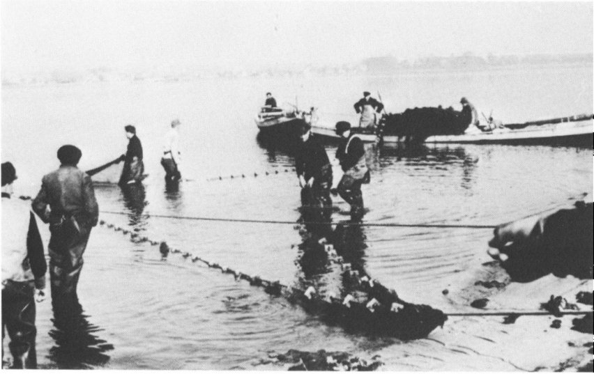
Vodfiskeri om vinteren, inden Slien er frosset til. Voddet trækkes i land. Ca. 1930.