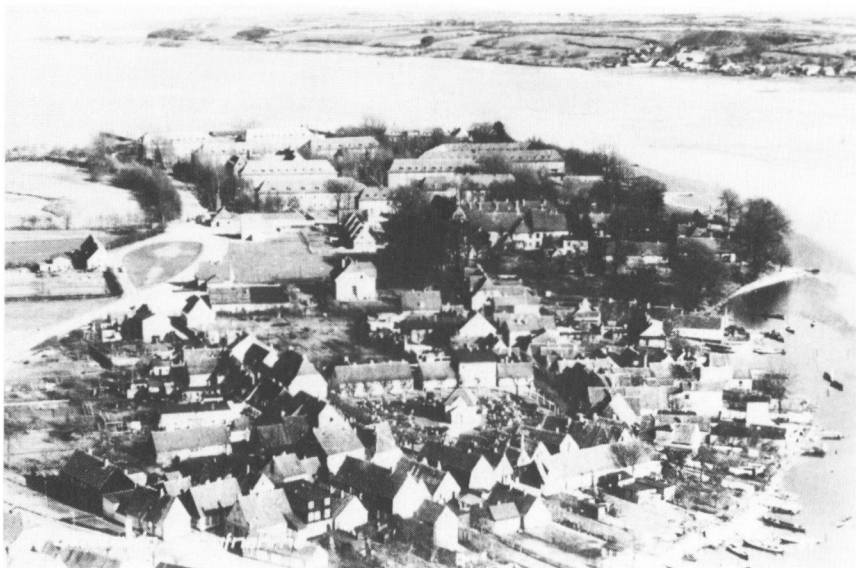
Fiskerlejet Holmen ved Slesvig foran, og kasernen Die Freiheit bagved i billedet. Kasernen blev bygget på holmernes tidligere nettørreplads Friheden. Fra 1939–1940.

Kappels erhvervsfiskere, som længe havde holdt sig uden for Sli- sildstriden, tjente derimod med årligt godt 1000–1200 M (1885–1886) rimeligt godt. Da Kappel-fiskerne i 1870'erne havde intensiveret deres vodfiskeri, og der fra 1880'erne i det hele taget blev færre sild i Slien, afkrævede Arnæs derfor i 1888 Slesvig ret til at fiske med alle slags garn, også med drivgarn (vod, Zugnetze) på hele Slien. Slesvig gik imod. Arnæs' småfiskere og Slesvigs vodfiskere havde tydeligt nok kun et for øje: at klare sig bedst muligt igennem en økonomisk vanskelig tid. Slesvig-, og nu også Arnæs-fiskerne, var jo anvist på fiskeriet som levebrød. I Kappel gik fiskeriet også tilbage, men her var der færre erhvervsfiskere, som tilmed havde lettere ved at klare sig, fordi silden jo først nåede til dem, før den kom til den øvre Sli, hvor Slesvig- og Arnæs-fiskerne fiskede. Kappel havde 15 erhvervsfiskere, som fiskede med vod. Desuden blev de få bierhvervsfiskere, der måtte være i Kap- pel, hurtigt opsuget af lokale industriprægede foretagender, som flæk- ken tiltrak.