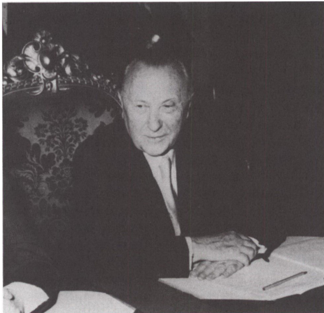
Dr. Konrad Adenauer, den vesttyske forbundskansler 1949–63. Adenauer prægede forbedelsen af normaliseringsprocessen i grænselandet, da han foranledigede en positiv tysk reaktion på det danske udspil om mindretalsproblemerne i efteråret 1954. Hans indflydelse på den konstruktive udvikling i grænselandet erkendes bedst, når man betænker, at det danske initiativ kunne være mødt med en fiasko, hvis forbundsregeringen havde afvist eller ignoreret de danske ønsker om en afklaring på problemerne i Sydslesvig.

Regeringen havde jo også tidligere afvist en egentlig statspolitisk aktion; men nu, hvor den kom, måtte man omhyggeligt søge efter en anvendelig formel. Henvendelsen blev formet som en appel til Bonn om en frisindet politik: »Der var ikke tale om at fremsætte en opfordring til at føre direkte dansk-tyske forhandlinger, man måtte håbe, at tyskerne af egen drift ville slå ind på en politisk retning, der ville føre til en bedre atmosfære i det dansk-tyske forhold«. 17 Man havde fra dansk side i øvrigt støttet tanken om at indbyde Dr. Adenauer til mødet, og Udenrigsministeriet tillagde hans personlige deltagelse væsentlig betydning for, at udfaldet blev så godt. »Som forholdene udviklede sig, må man anse det for at være et stort held, at Dr. Adenauer var tilstede, da sagen blev fremført«. 18