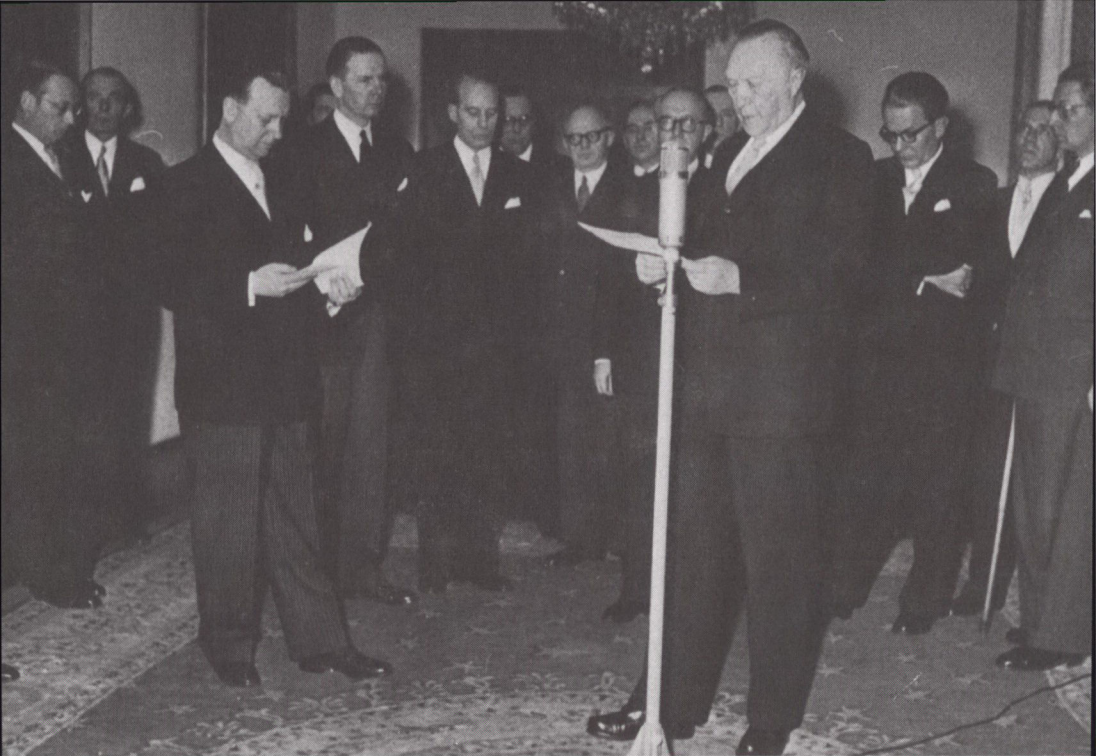
De dansk-tyske mindretalserklæringer afgives i Bonn den 29. marts 1955. Her ses i forgrunden den danske stats- og udenrigsminister H. C. Hansen (til venstre) og den tyske forbundskansler Konrad Adenauer (til højre) sammen med de embedsmænd, der havde deltaget i de afsluttende drøftelser, der førte til Bonn-København erklæringerne.

at vi skulle blive vidne til opbygningen af et så tæt net af kontakter på alle områder.