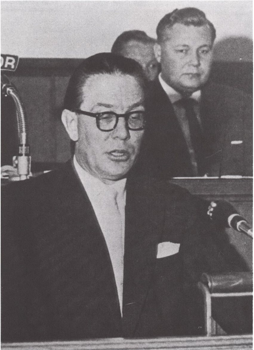
Kai-Uwe von Hassel. Han efterfulgte 1954 F. W. Lübke som slesvig-holstensk ministerpræsident. I grænselandspolitikken gik han ind for en hård linje over for det danske mindretal og ønskede ved at sammenkæde de danske og tyske mindretalsproblemer at aftvinge danske indrømmelser i Nordslesvig. Som ministerpræsident startede han i 1954 med at kræve en dansk-tysk mindretalstraktat, men fulgte siden de politiske signaler fra Bonn og slog ind på en blødere kurs over for det danske mindretal i Sydslesvig.