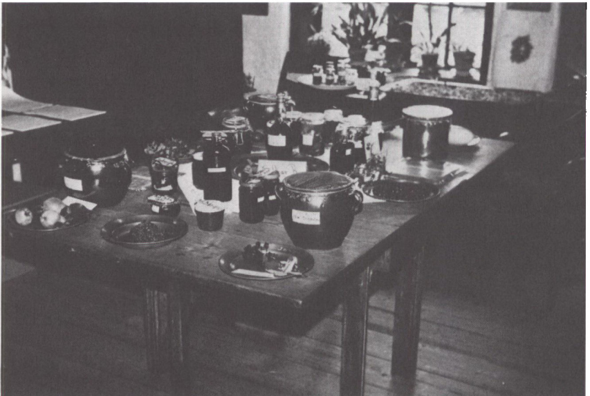
Fra septemberudstillingen: Syltetøj af alle arter, klar til vinterens komme.

Den 5. juni fejredes gårdens 25års jubilæum med en reception i øsende regnvej. Den havde samlet ca. 80 gæster. Efter at der var givet en redegørelse for samlingens formål og baggrund, talte borgmester Camma Larsen-Ledet, der medbragte en gavecheck fra byen. Selskabet besøgte derefter den udstilling af tekstiler, der var skabt i dagens anledning.