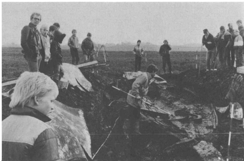
Vraget af en 1600-tals båd under udgravning i Slivsvø v/Hoptrup.

3-4000 sønderjyske gravhøje, der ligger i dyrket mark, og der skal ikke gå mange år, før højene er forhenværende. Ja, mange er idag allerede helt udjævnede. Ifølge Naturfredningslovens gode intentioner skal alle fortidsminder, der trues af ødelæggelse, undersøges, så man i det mindste kan få videnskabeligt udbytte af dem. Men Rigsantikvaren, som ifølge loven skal betale for udgravningerne, har haft så få midler til rådighed, at kun en brøkdel af de mest nødvendige udgravninger har kunnet gennemføres. Vi må desværre tit se fortidsminder langsomt gå til uden at kunne gribe ind.