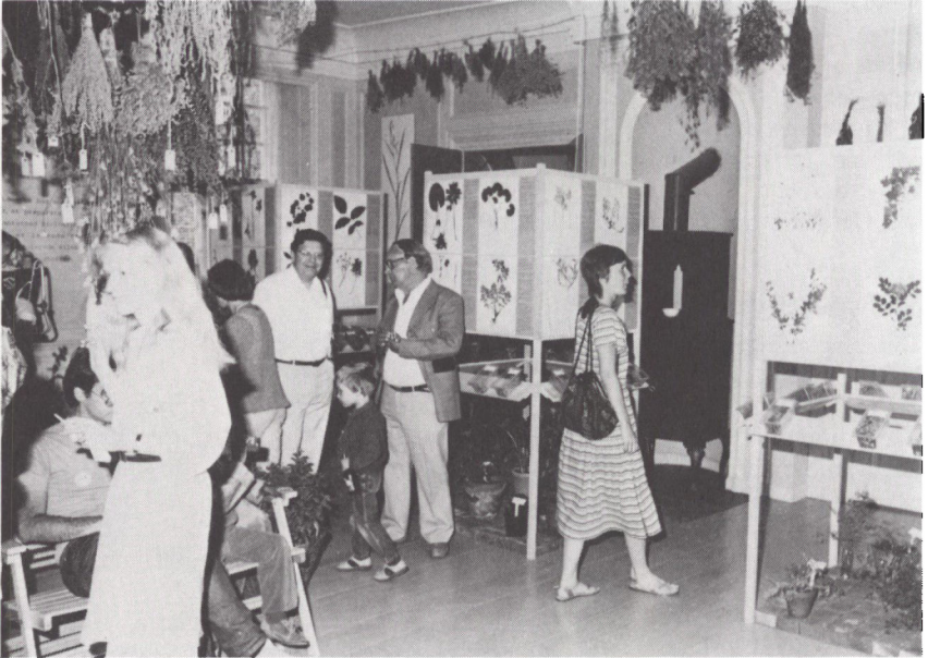
Fra åbningen af lægeplanteudstillingen på Midtsønderjyllands Museum.