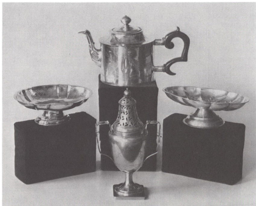
Fra museets sølvsamling.