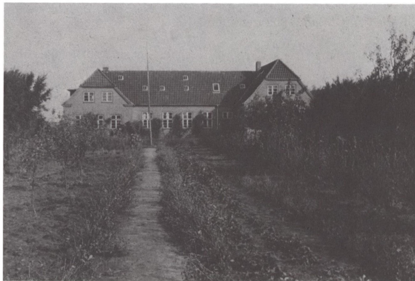
Kirkevang efter krigen, med den tilbyggede elevfløj til ungdomsskolen fra 1952. Dette billede er forlængst blevet historie, sådan som omgivelserne hastigt har forandret sig; men forsamlingshuset står og fungerer endnu. (Privateje)

Den umiddelbare efterkrigstid var også karakteriseret af kølig beregning og opportunisme, når det drejede sig om national orientering. Den lokale tyske præst havde indtil sent på krigen, som store dele af befolkningen, været nazist. For en kort stund efter 1945 blev han som mange andre tyske holder af Flensborg Avis og fortsatte i øvrigt derefter sin traditionelle tysk-nationale linje. Klasseskel, aggressiv nationalisme og politisk intolerance karakteriserede også efterkrigstidens Sydslesvig og Holsten. Først langsomt trængte demokratiske spilleregler ind. For min far var det især et problem, at vesttyskerne så tidligt fik lov at bære våben, og at gamle, og svært kompromitterende, nazister så let fik pladser i solen.