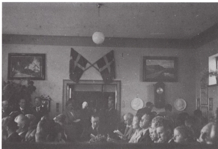
Dansk møde i Kirkevangs tidlige år. I forsamlingshuset kunne man tale frit, og det var der behov for allerede 1933-34.