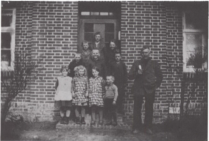
Vandreskole i Agtrup få kilometer fra Ladelund i begyndelsen af trediverne. (Privateje)

Det tidlige forår blev hedt. Protestbevægelsen forsøgte sig med noget nyt, mens aktivismen i øvrigt bredte sig til andre tyske landbrugsregioner. Den ny kampform var »Nothilfe«, og hvad man forstod ved denne form for »nødhjælp« kunne man erfare på 12 møder, bl.a. i Læk. De revolutionære grupper ville have magten i de lokale selvstyreorganer. Myndighederne slog imidlertid hurtigt til over for denne demonstrationsform, hvorefter de militante kræfter atter slog sig på udpantninger og tvangsauktioner. Radikaliseringen afspejledes ligeledes i bevægelsens ny avis Landvolkzeitung, der oktober 1929 allerede havde 10.000 abonnenter, hvilket var mange i de daværende magre tider. Større kampagner sattes i gang i forbindelse med retssagerne mod demonstranter og skattenægtere. Processerne blev brugt til politisk propaganda. Spredte moderate kræfter søgte f.eks. i Angel og Sydtønder at bremse de højreradikale, men havde ikke held eller politisk og organisatorisk styrke til det. Imens fortsatte radikaliseringen.