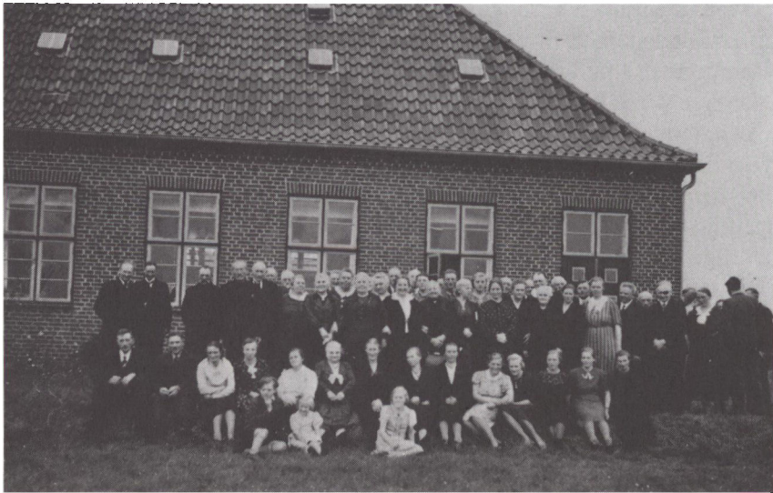
Deltagerne i indvielsesfesten for forsamlingshuset Kirkevang den 9. september 1934.