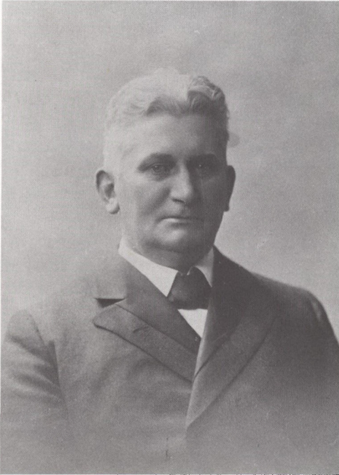
Jacob Appel (1866–1931), forstander for Askov Højskole og kulturminister 1910–13. Han blev forud for genforeningen udpeget til skoledirektør for de sønderjyske landsdele og var i alle forhandlinger om skole og kirke en indflydelsesrig formidler mellem centraladministrationen og Vælgerforeningen i Nordslesvig. Fra 1920 igen undervisningsminister, 1922–24 tillige kirkeminister.