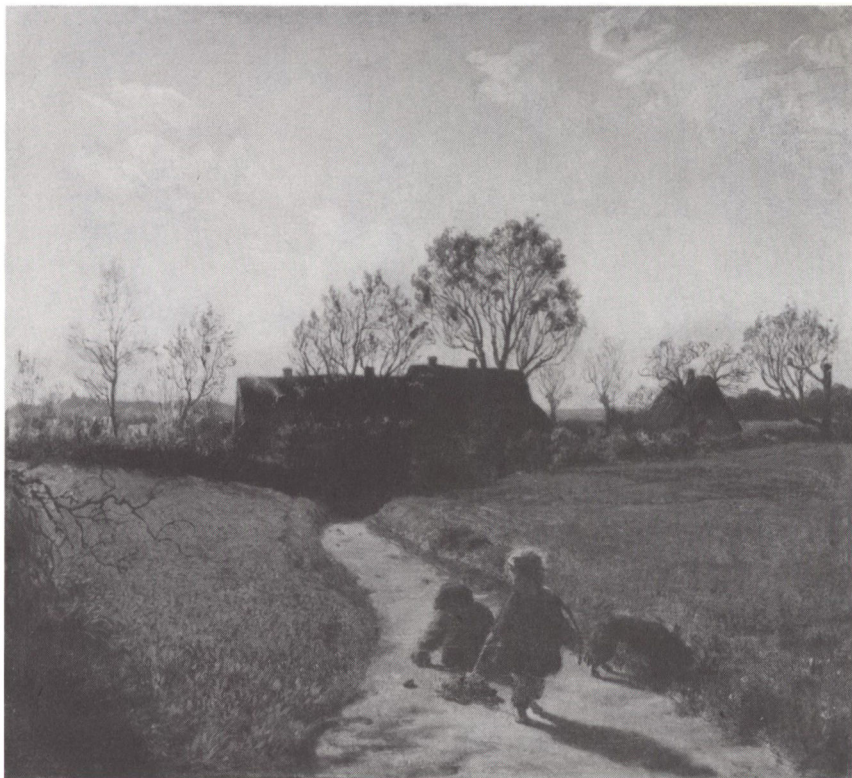
Landskabsmaleri fra Lorenz Frølichs Flensborgtid: Landskab med huse og børn.