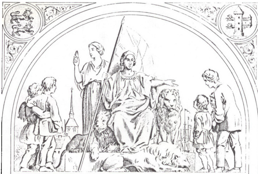
Tegning til grundstenspladen til Flensborg Latin- og realskole.

øvede sin tiltrækning, fremgår af skitsen »Niels Ebbesens hjemfærd«, hvor dog de maleriske problemer – modlyset f.eks. – helt har taget overhånd. Det udtryksfulde samspil mellem helten og kvinden, der skænker ham sit fattige brød, er langt heldigere udformet i de tegninger eller kemityprier, hvor han tidligere havde syslet med emnet. 26