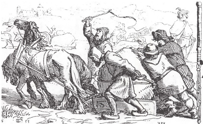
Lorenz Frølich som bogillustrator 1855. Tegning af bønderne, der slæber sten til bygningen af Kalø slot. (Danmarks illustrerede Almanak for 1856)

de jætters og trolde – dog aldrig for stor til at lade de små, børnene og dyrene, komme til sig.« 28