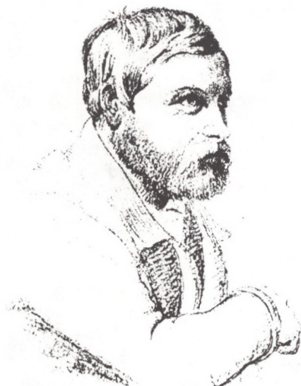
Lorenz Frølich (1820–1908), maler og tegner, er nok mest kendt som skildrer af mytologiske og historiske optrin. Flere af hans arbejder blev til i Flensborg, hvor han boede i årene 1854–57. (Tegning af Vilh. Kyhn, Rom 1851).