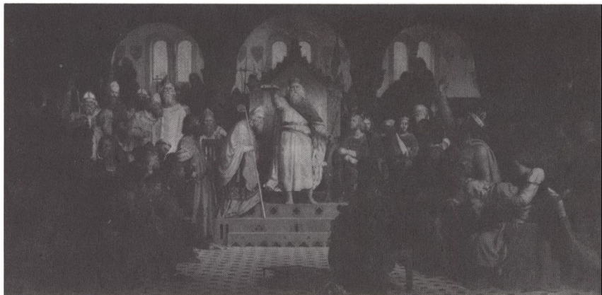
Et af de klassiske Frølichmalerier: Valdemar Sejr giver 1240 Jyske Lov. Billedet var sammen med et maleri af Frederik 4., der hyldes af stænderne på Gottorp 1721, malet til appellationsretten i Flensborg. Det blev 1882 flyttet til det nye domhus i byen, hvor det stadig hænger.

mytologiske billeder, satte ministeriet i maj 1853 kunstneren stolen for døren, idet man over for Winstrup i utilslørede vendinger pegede på, at udførelsen af maleriet måske skulle overdrages en anden kunstner eller helt opgives. 6 Resultatet blev, at Frølich to måneder senere afsendte 5 skitser, nemlig foruden de to, der var ønsket af ministeren, to mytologisk inspirerede («Asernes guldalder» og «Lokes straf») samt »Dronning Thyra ved bygningen af Danevirke«. Inden Winstrup afleverede dem til ministeriet, blev de fremlagt i en sal i Flensborgs rådhus »for at alle gode venner (i al hemmelighed) kunne glæde sig derover«. 7