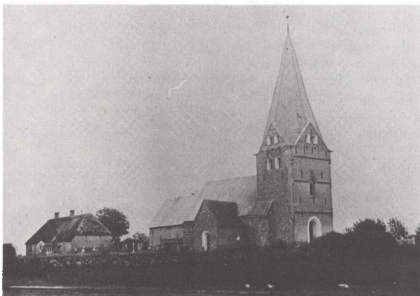
Daler kirke, set fra nordvest ca. 1920. Omkring kirkegården ses stendiget, der gennem århundrederne har givet anledning til adskillige disputer; jf. s. 20. T.v. i billedet ses den gamle skole.