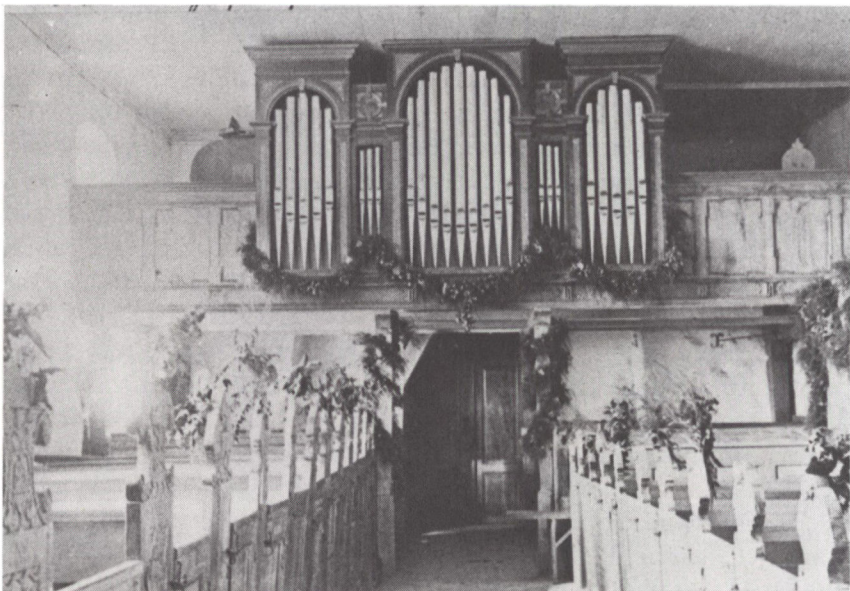
Daler kirkes indre, set mod vest ca. 1920. Pulpituret var endnu ikke opsat under stridighederne 1707–09, men blev det under menighedens protest et par år senere. Det var nyt 1713, men døren til det var i nogle år som følge af andre stridigheder tilspigret. Orgelet er fra 1893.