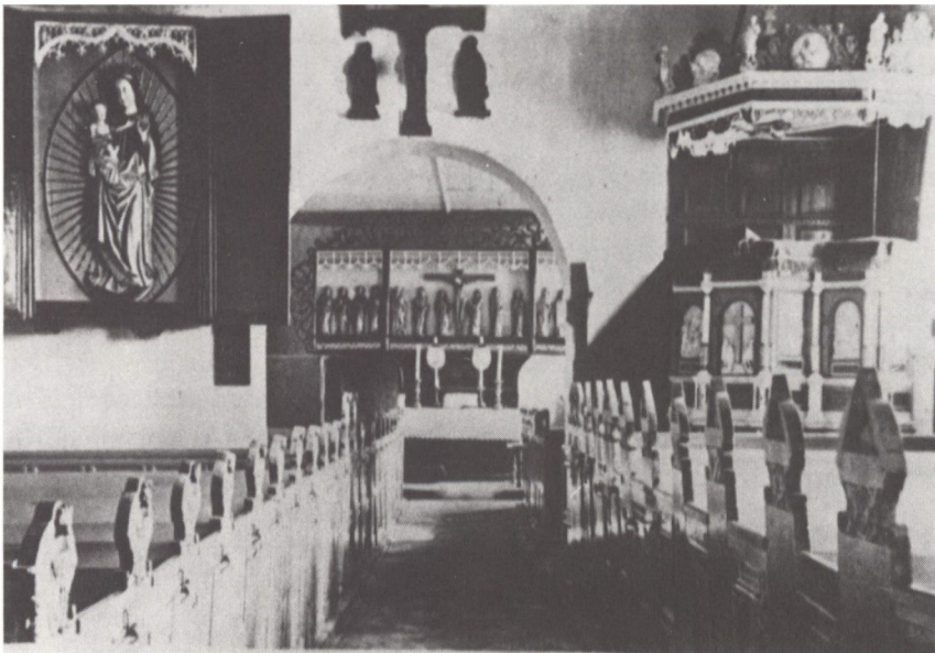
Daler kirkes indre, set mod øst. T.v. den smukke tavle, hvorfra Jomfru Maria sikkert med store, undrende øjne har set ned på optrinene på midtergang og i mandsstolestaderne mellem provst, præst og menighed 1707–08.