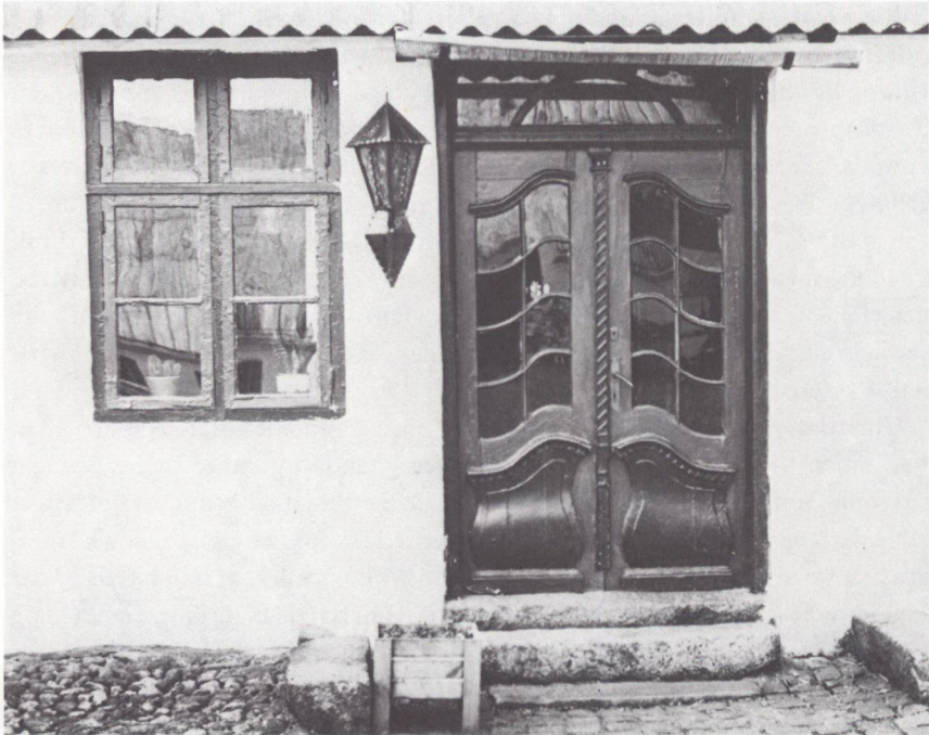
Dør fra gårdsiden i barokstil i Fogedgården. To døre og flere vinduer går tilbage til 1700-tallet.