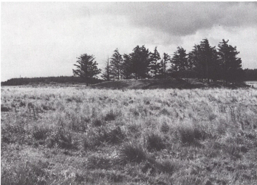
Voldstedet Søndervold i Roost enge, Arrild sogn, i modsætning til Nørrevold stærkt forstyrret i århundredernes løb. Om dette voldsted har haft tilknytning til en bestemt gård i Roost, har endnu ikke kunnet afgøres.