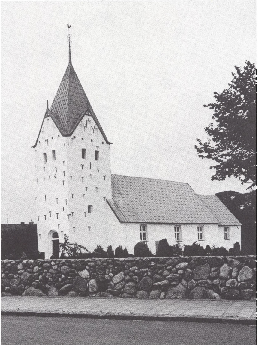
Arrild kirke, hvor inskriptioner og gravsten minder om den betydningsfulde Outzen slægt.