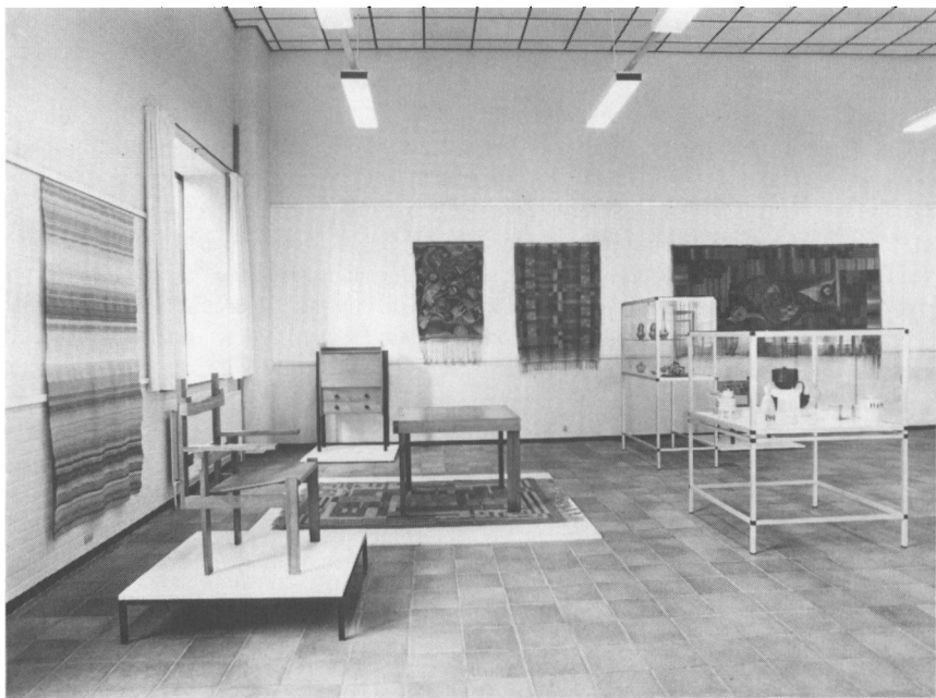
Fra kunstmuseets Bauhaus-udstilling i 1980. I forgrunden ses Marcel Breuers berømte stol, og i baggrunden th. Klees fugletæppe.

Efter den meget kostbare BAUHAUS-udstilling i 1980 er der arrangeret 14 mindre udstillinger, 4 af dem i andre lokaliteter, 6 separatudstillinger, 1 gruppeudstilling, 2 tema-udstillinger og 1 kunsthåndværkerudstilling. Samarbejde har vi haft med Kastrupgård, Glyptoteket, Kunstforeningen i København og museerne i Gram, Haderslev og Sønderborg og kunstforeningerne i Haderslev og Sønderborg, samt Løgumkloster Højskole.