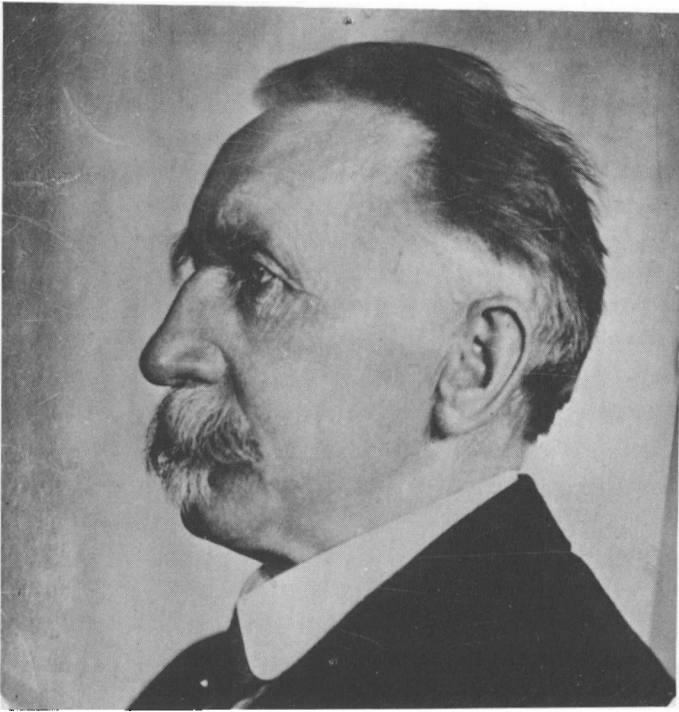
H. P. Hanssen (1862–1936).

brud i november 1918 havde han med de nye forhold for øje foreslået, at sønderjyderne i den første valgperiode skulle danne en egen gruppe i folketinget. Gruppen skulle ikke være bundet til noget parti, men blot varetage sønderjyske interesser.