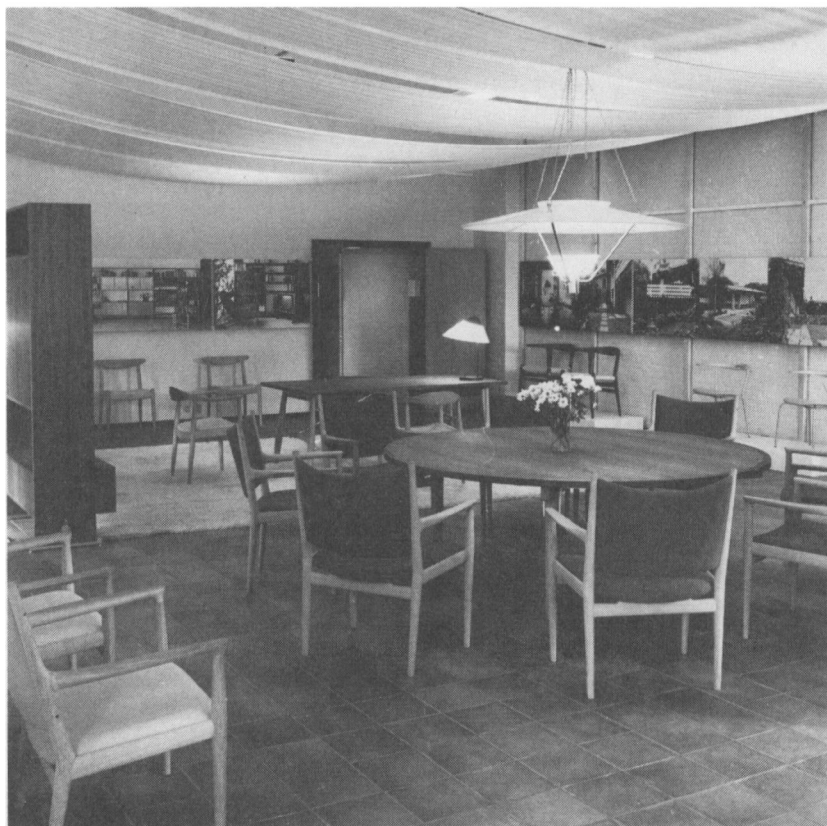
Fra Wegner-udstillingen i Sønderjyllands Kunstmuseum juni/juli 1979.