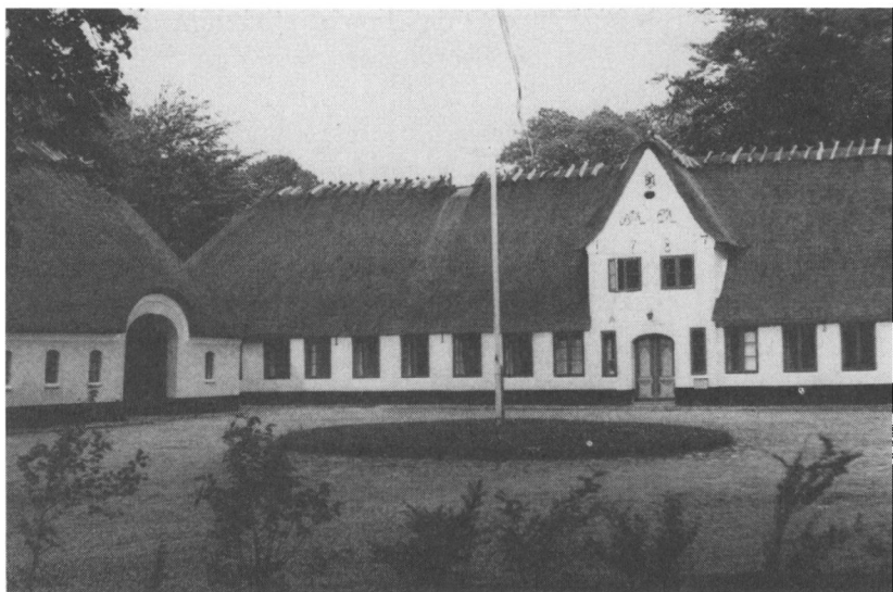
Felsted præstegård, hvor den bidsige diskussion mellem Godt og Mørk Hansen foregik den 18. maj 1864. Præstegården er opført 1787 og er med sine to store smukke ladebygninger, hvoraf den nordlige ses til venstre, et meget fint og beløst anlæg.

dette spørgsmål stå åbent. Han må derfor antage, at Binzer vil forbeholde sig at benægte, at disse rettigheder er krænket.