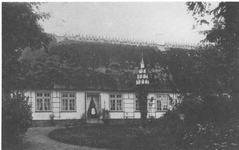
Varnæs præstegård set fra haven ca. 1900. Den stråtækte bygning er opført 1779.