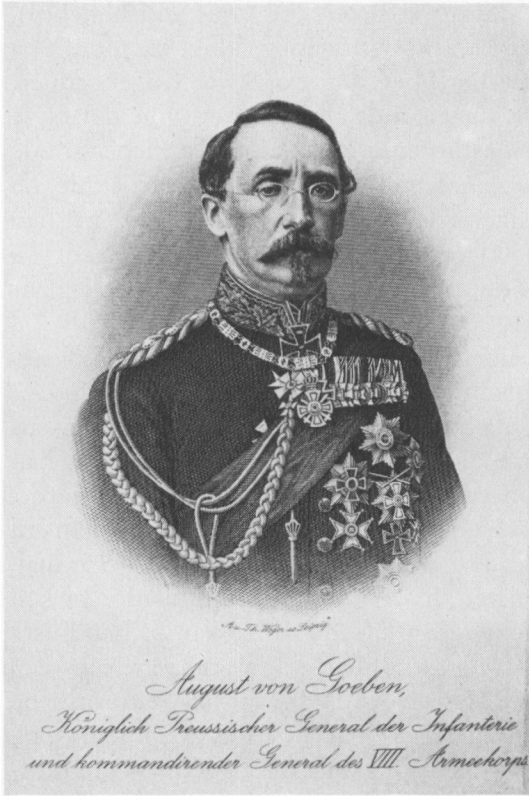
August v. Goeben, født 1816 i Stade ved Elben, deltog som general i Preussens krige 1864, 1866 (imod Østrig) og 1870-71 (imod Frankrig), død 1880 i Koblenz. (Efter stik i hans biografi (se note 9 side 67)).