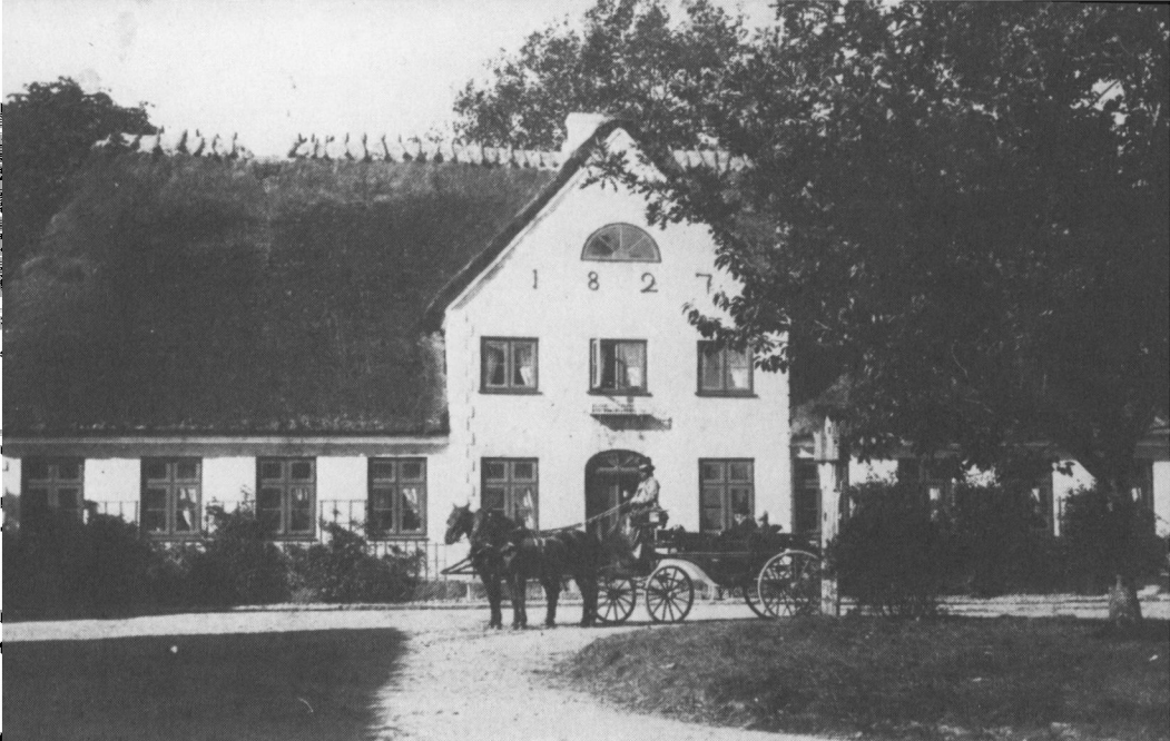
Ullerup præstegård i slutningen af forrige århundrede før ombygningen, hvor stråtaget blev fjernet og huset forhøjet med en trempeletage. Hvem der holder i vognen foran huset vides ikke. (Historiske Samlinger).

strider mod Guds bud«. – »Nej – det var langt fra hensigten«, og – forhøret var dermed til ende«.