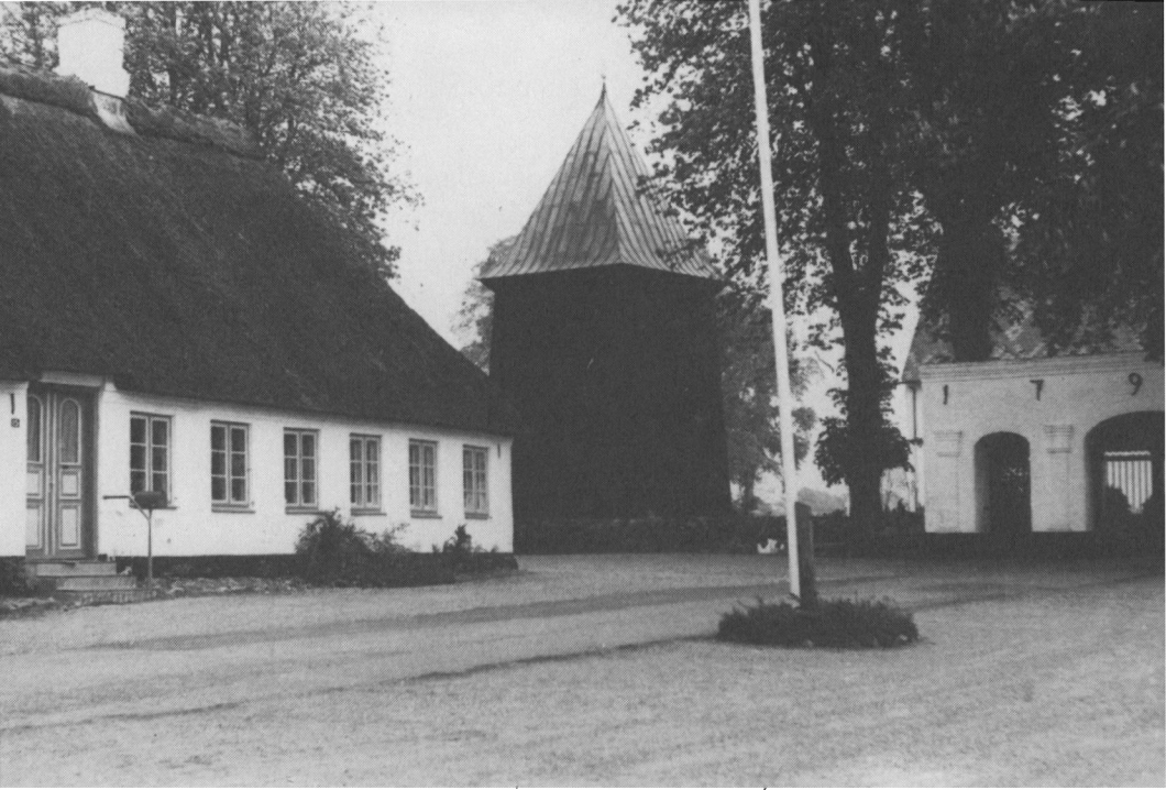
Til venstre den gamle skole i Felsted, hvor Godt holdt visitats. Skolen er bygget 1751. I midten klokkestablen fra 1769 og til højre kirkegårtsportalen fra 1796.

stof gennem den almindelige læsebog for folkeskolen og en god ledetråd for de højere klasser. Godt var derfor på vagt overfor disse bøger. Af landkort kasserede han et Danmarkskort, fordi det bar titlen: »Danmark med Hertugdømmerne Holsten og Lauenborg«. Han forbød dette kort, »hvor Slesvig er forsvundet som hertugdømme og synes inkorporeret i Danmark«.