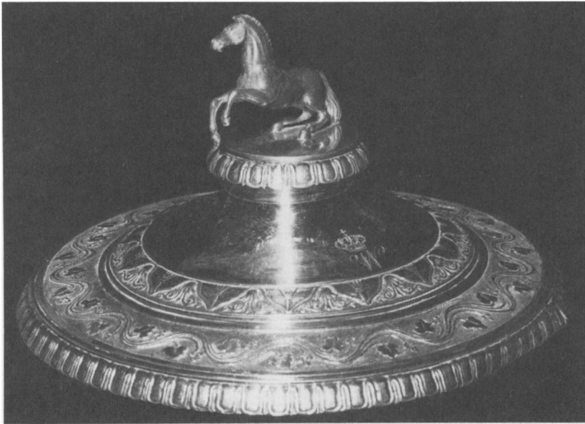
Fig. 10. Billedet viser os Slesvig-pokalens låg (side 18 nr. 3, jfr. billedet side 20) med kronprinsesse Wilhelmines kronede navnebogstav. Hun giftede sig 1838, efter at være blevet skilt fra prins Frederik (7.), med prins Carl, senere hertug af Glücksborg, og kom til at leve resten af sit liv i hertugdømmerne, først på slottene i Kiel og Louisenlund og fra 1871 på Glücksborg slot.