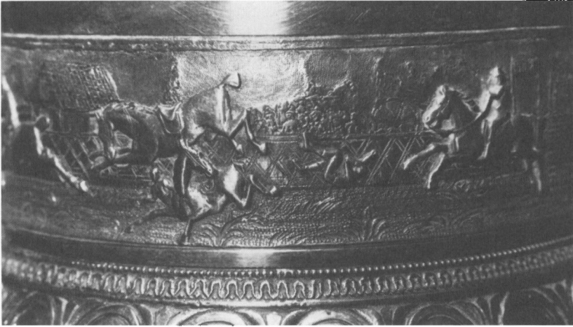
Fig. 1. Udsnit af den drevne frise omkring Slesvig-pokalen (side 18 nr. 3) med en episode, hvor en hest kaster sin rytter, hvorved også en anden falder af. Bag indhegningen ses tilskuere. En anden del af frisen viser dommertribune, telt m.m.

værdifulde og nødvendige i avlen for udvælgelsen af de rette dyr og for at animere avlerne til en indsats; dette slår han til lyd for i flere afhandlinger. De væddeløb hertugen årligt lod afholde ved Augustenborg tog efterhånden form og i 1827 indrettede han sig en ny bane. Væddeløb og auktion afholdtes i forbindelse med hertuginde Louise Sofies fødselsdag 22. sept. Der var ved den lejlighed foranstaltet forskellige festligheder. Adelige og andre hestesportsinteresserede fra hele Slesvig-Holsten deltog, og der sås også deltagere fra det øvrige Danmark og udlandet. Løbene strakte sig over 2 dage og var arrangeret for herrer (adelige og godsejere) og landboere hver for sig. Der blev redet om penge, sølvbægre, pokaler m.m. Af særlige løb må nævnes Caroline Amalie- , Christian August- , Louise- og Louise Augusta-løbet . Hver især af navngiverne til en konkurrence udsatte en pokal som præmie. Ingen steder var der så mange fornemme sølvpræmier som i Augustenborg , og de bidrog til at gøre væddeløbene dér ganske særligt festlige og tiltrækkende. Foruden den hjemlige aktivitet var hertugen virksom og arbejdede for udbredelsen af sin hobby flere andre steder i Hertugdømmerne , hvor han medvirkede ved at være