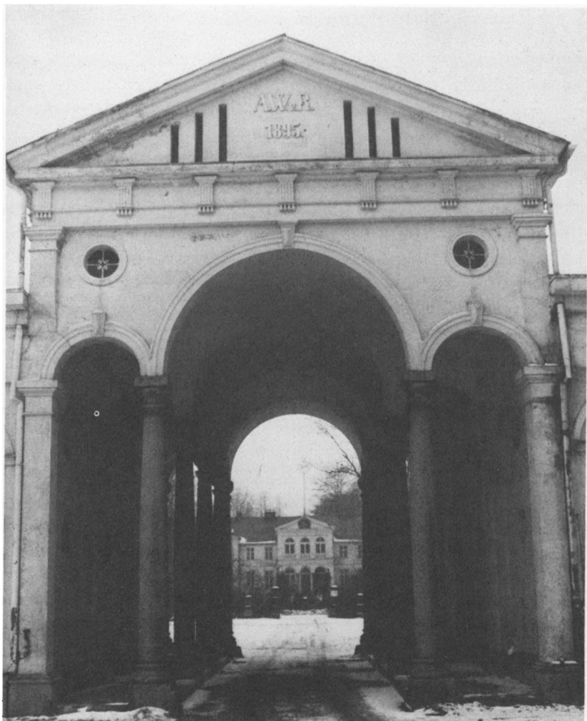
Fig. 5. Indkørslen til godset Rosenkrantz, hvis hovedbygning, opført 1791 og stærkt ombygget i 1890'erne, ses i baggrunden. Porthuset er opført 1895 af Axel Weber v. Rosenkrantz og bæres af otte slanke søjler afdækket med en lav trekantsfronton. I 1895 blev tillige de gamle stalde, der husede Dr. Webers ædle heste, nedrevet og istedet opførtes nye stalde på hver side af porthuset og sammenbygget med dette. (Foto af Liselotte Riis).

skilte sig ud fra hans flertal i visse sager. 1862 optog hertugen af Sachsen-Koburg og Gotha ham i den friherrelige stand med navnet friherre Weber von Rosenkrantz.