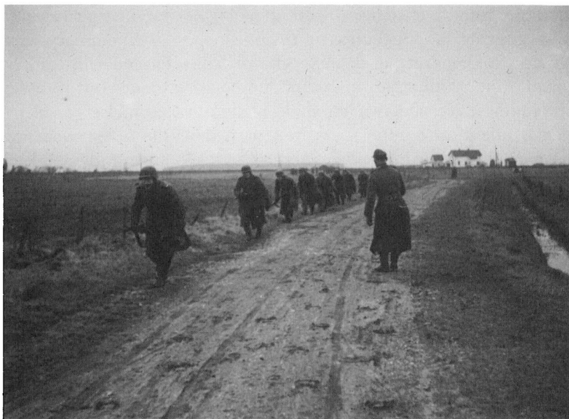
»Zeitfreiwillige« på øvelse.

Løgumkloster ved Lindet skov. Der kom besked tilbage, at vi kunne vente nedkastning af containere fra engelske fly. Vi var en lille gruppe, der nu forberedte os på at modtage det første sprængstof. Nøje blev det aftalt, hvor vi skulle mødes, og hvilke pladser vi skulle indtage. Cyklerne fik et ekstra eftersyn, for det var i al beskedenhed en tur på 70 km frem og tilbage. Hver aften lyttede vi til London, spændte på, om der mellem de mange hilsener skulle være hilsen til os.