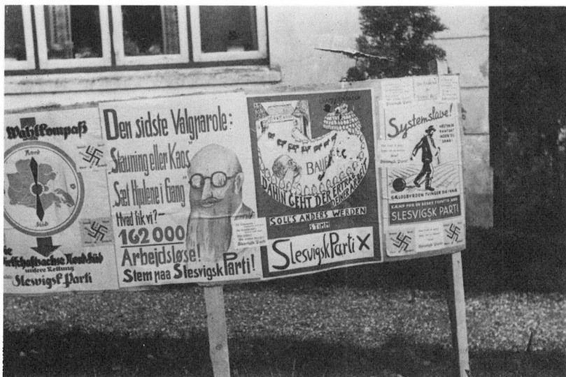
Valgplakater fra Slesvigsk Parti 1939. Bemærk plakaten i midten, hvor statsminister Stauning er forsynet med jødiske træk i et forsøg på at spille på tidens antisemitisme.

langt. Der var da også ialt med en ret stor gruppe børn, så vidt jeg talte, over 700. Tavse, stirrende lige ud kom de gående. Hverken fra de marcherende eller tilskuernes side hørtes noget. Kun de lange, sorte støvlers taktfaste tramp gav genlyd mellem husene. Gaden lå næsten mørk, da lyset i de danske forretningers vinduer var eller blev slukket. Samme dag var den mest provokerende valgplakat kastet ind gennem brevsprækken. Den lød: