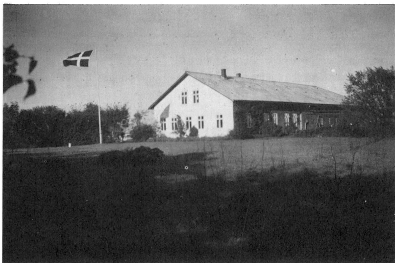
Sommersøndag på Søgård. – Gården var en vinkelbygning med stuehus mod syd. Herfra gik man ud i stalden og videre til laden, der lå vinkelret herpå. Gården var bygget 1909 og lå ikke som marskgårde på en værft. (Privat eje)

underholdt med sange, og Marcussen, hvem jeg havde fortalt om spejdernes økonomi, gav løfte om, at D.U.G. ville betale udgifterne ved påsketurten, så det var nogle glade piger, vi dagen efter kunne følge op til diget, hvorfra de cyklede tilbage til Flensborg og hverdagen der. At bekende sig som dansk pigespejder i Flensborg i 1936 var en stor ting, og disse piger i alderen 12–15 år imponerede mig ved, at de så tappert vedkendte sig deres danske sindelag.