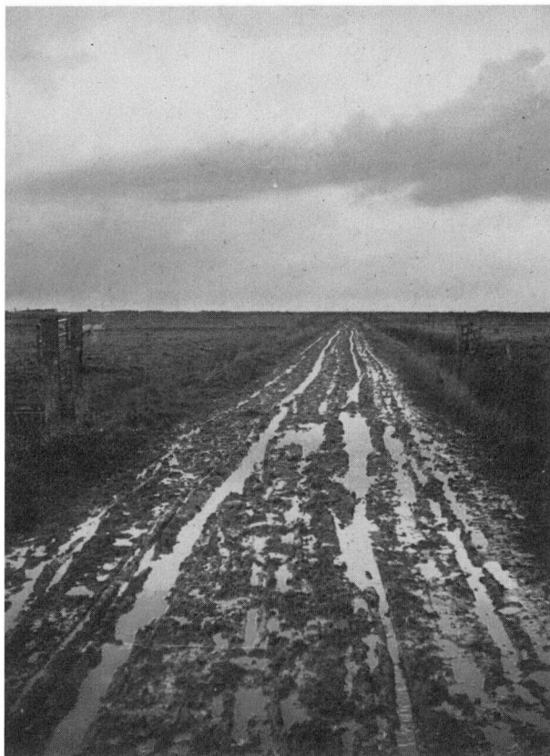
Vejen til Søgård - et fire kilometer langt, bundløst ælte de syv måneder af året.

skulle gå mere end 25 år, før der kom fast vej til Søgård. Vandledninger forsyner nu marskens gårde, lys og kraft er indlagt; men landbrugets udvikling har medført, at den store bebyggelse af marsken er udeblevet, selv om der er kommet flere ejendomme, og der er sket en jordfordeling, så mulighederne for mere rationelt landbrug er til stede.