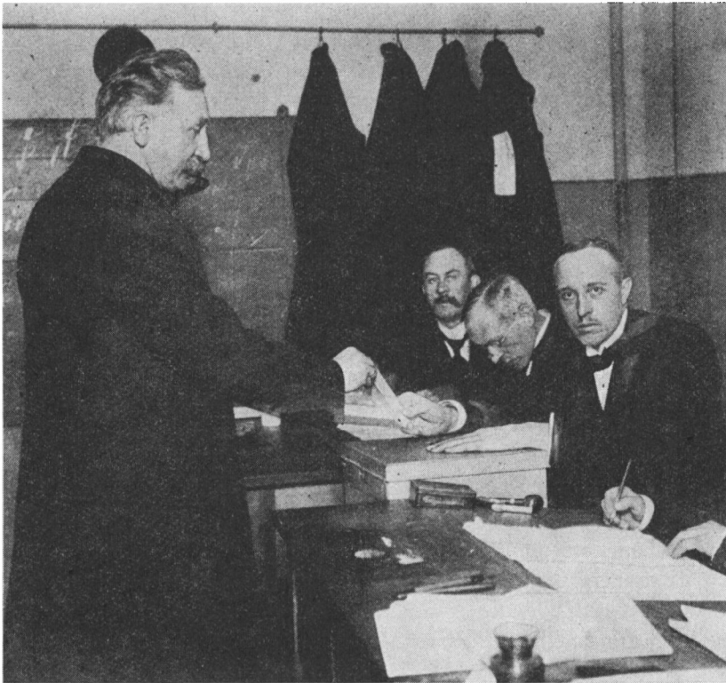
H. P. Hanssen, der som rigsdagsmand 1906–18 havde været den nordslesvigske danskeheds samlingspunkt, afgiver sin stemme i Åbenrå ved folkeafstemningen den 10. feb. 1920. – Ved sin indtræden som sønderjysk minister i det radikale ministerium Zahle var Hanssens forhold til partiet Venstre blevet stærkt belastet, og det bidrog på forhånd til at vanskeliggøre realiseringen af hans plan om etableringen af en sønderjysk særrepræsentation på Rigsdagen i tilknytning til Venstre.

grunden, og det fælles danske kom noget mere til sin ret.« 9 Kongerigsk partipolitik havde man åbenbart ikke meget tilovers for.