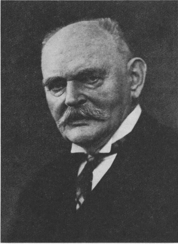
Venstrepolitikeren Niels Neergaard (1854–1936), statsminister 1920–24.

fastsat til d. 1. juli. Stauning skulle have talt ved et møde i Haderslev i slutningen af maj, men det aflystes. Det første møde fandt sted i Haderslev d. 17. juli. 36