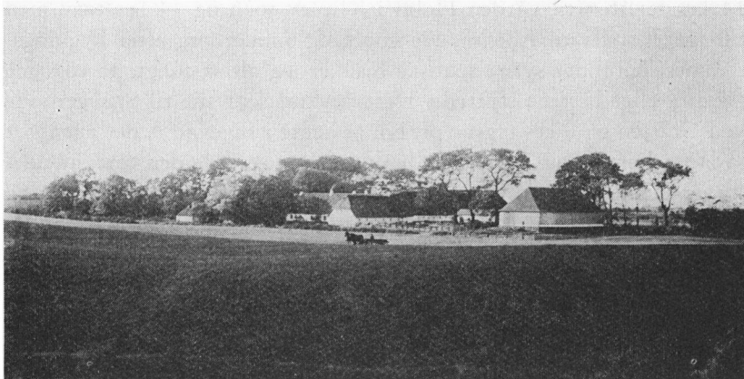
Ladegård i Kværsgård sogn. Det menes, at hovedbygningen blev bygget i anden halvdel af 1700-tallet, og de skærpede krav fra herremanden til bøndernes ydelser i forbindelse med byggeriet var sikkert stærkt medvirkende til, at striden med Tumbølbønderne blussede op i 1762.