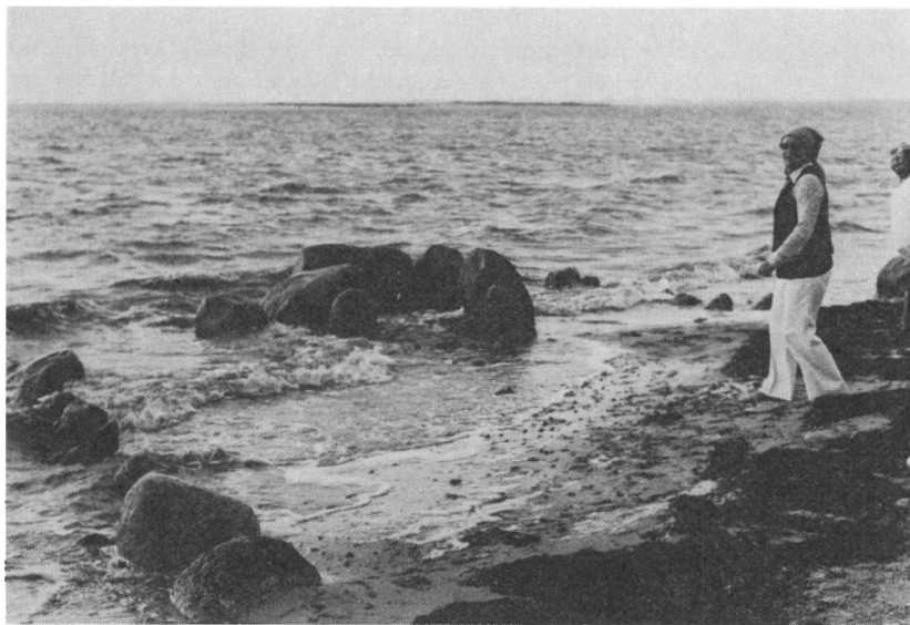
En jættestue i strandkanten ved Arksrum vidner om den landsenkning, der er sket. (Foto: Inger Bjørn Svensson).

Ramskous foredrag blev et af turens højdepunkter. I 1975 skulle vi sydpå, og man vedtog, at turens deltagere skulle »vandre« til Sild. Man vedtog også, at der højst kunne deltage 250 personer, og som sædvanlig meldte der sig så mange, at der blev sat en ekstra bus ind. Alligevel måtte vi med bedrøvelse sende afbud til 44. Endnu engang måtte vi diskutere, om vi burde gentage udflugten, så vi fik to ture med færre deltagere pr. gang. Vi blev 287 i 1975, og det er faktisk for mange.