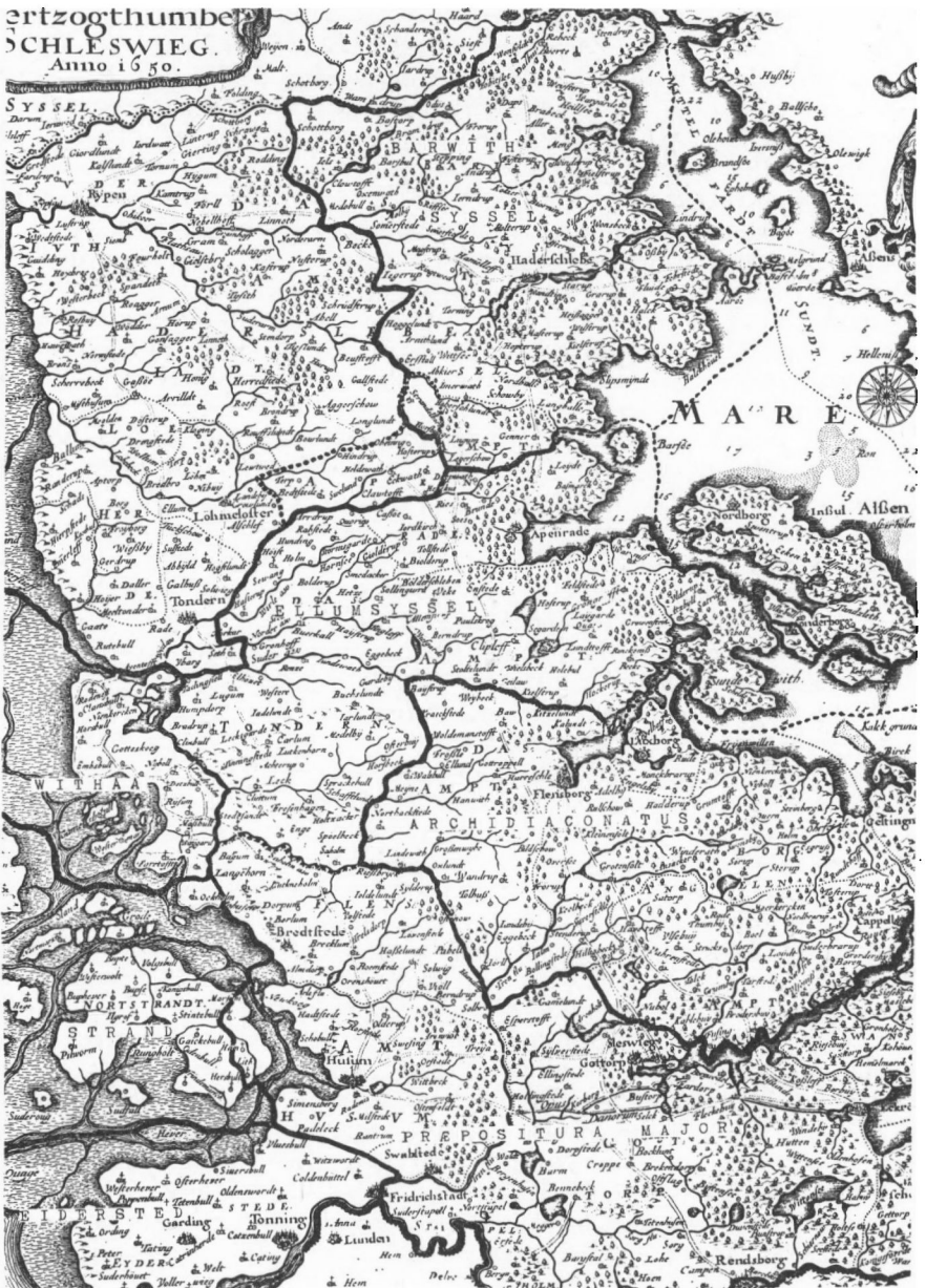
De gamle stiftsgræns. Kortet findes side 180 hos Gregersen.