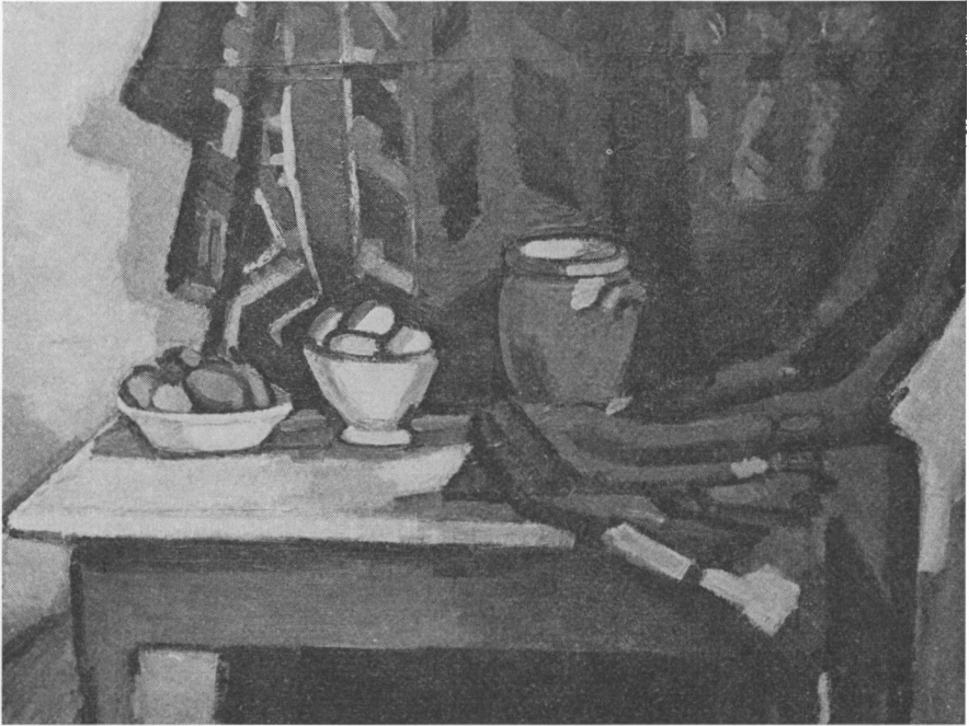
Vilhelm Lundstrøm: Nature morte 1915? Sønderjyllands Kunstmuseum.