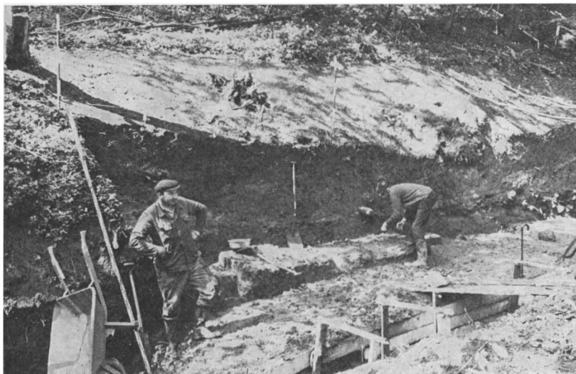
Udgravningen i Vejstrupskov, maj 1972.

essante fund fremtidig skal vises. Dermed er vort forståelige ønske om at kunne vise det nye i vort område foreløbig imødekommet, og vi kan roligt imødesee de nye fund, som dukker op, og planlægge den næste gravning, som må komme inden for længe. Vi kan få meget mere at vide om disse fjerne tider.