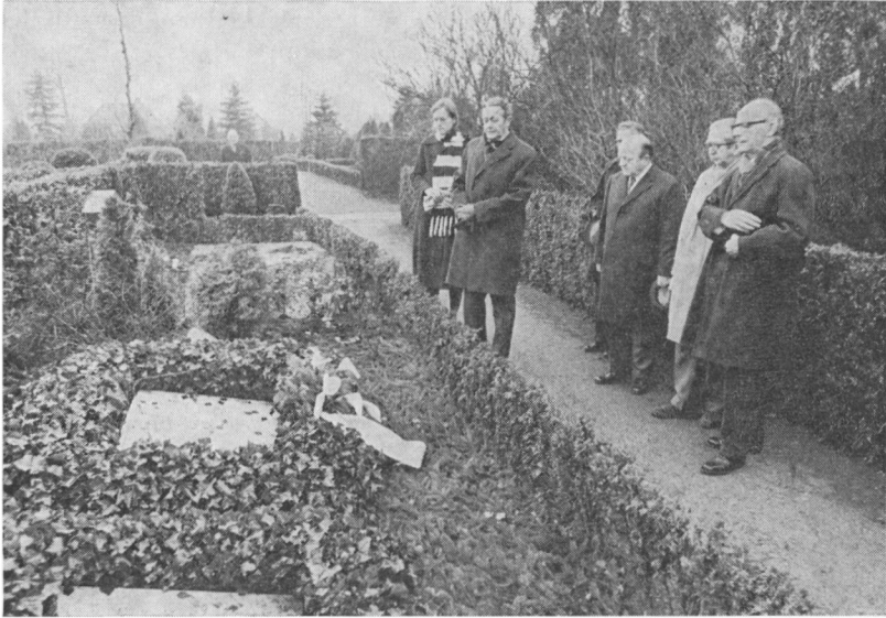
Fra kransenedlægningen på H. P. Hanssens grav på Abenrå kirkegård.