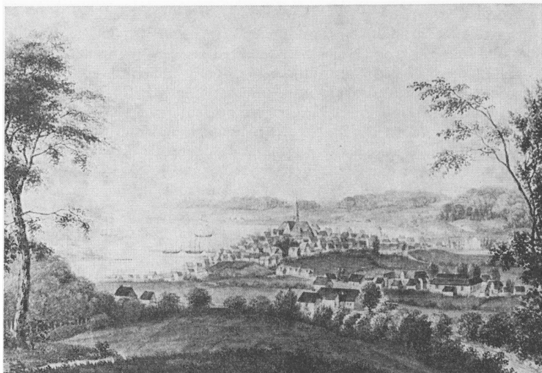
Fra Åbenrå museums samlinger. (Foto: Finn Bach, Åbenrå).