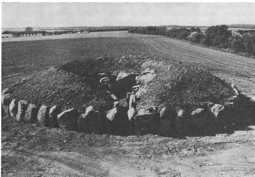
Tomnehøj-jættestuen ved Rådehoved. Efter udgravninger og restaurering 1972.